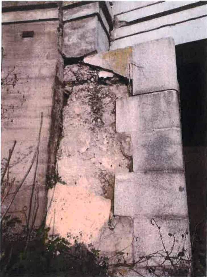
Pravý bok opěry O1, hluboko rozpadlý beton po celé výšce dřívku, následek dlouhodobého zatékání dilatační spárou.