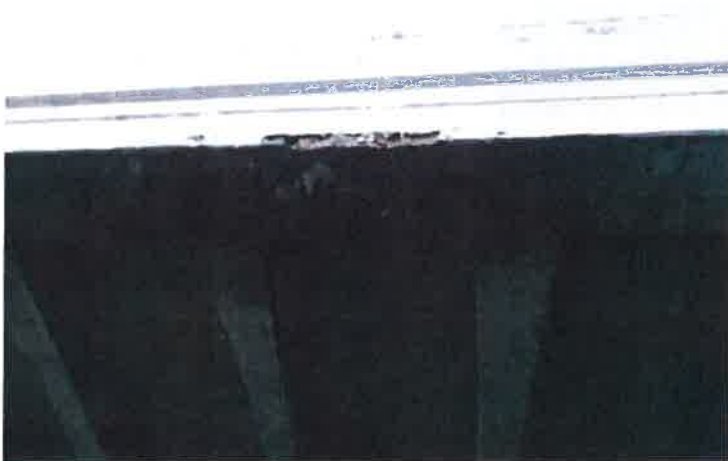
Detail spodní plochy pravého trámu v poli 3. Na hraně okapního nosu trhliny s průsaky, výluhy krápníčky, v oblasti zatékání korozní skvrny, porucha krycí vrstvy.