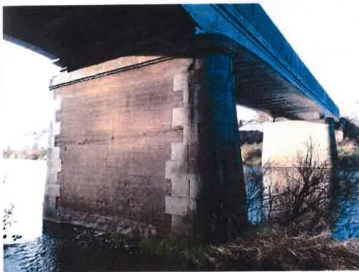
Pohled na P bok mostu s pilířem P3 v popředí.