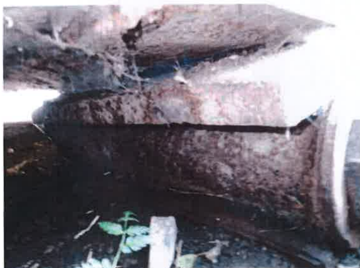
Porucha ložiska – při 10°C je v krajní poloze