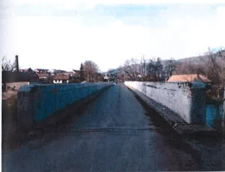
Prostorové uspořádání na mostě, pohled proti směru staničení.