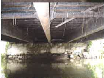
Pohled na spodní líc nosné konstrukce a opěru I