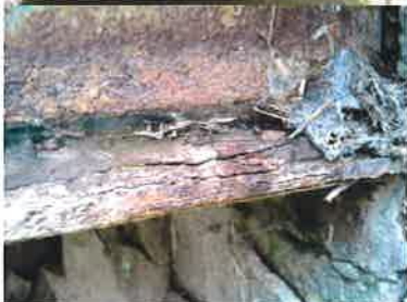
Detail koroze hlavního nosníku - korozní úbytek / rozpad