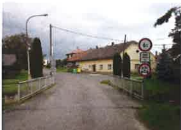
Příčné uspořádání na mostě - pohled proti staničení