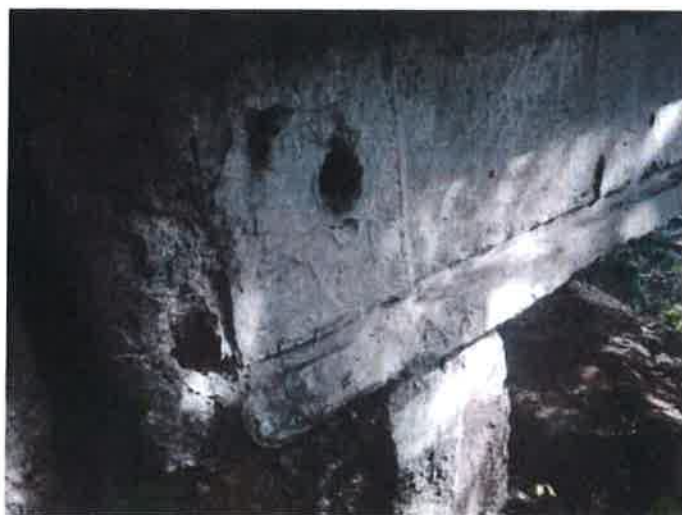
Zátékání a koroze – uložení NK.