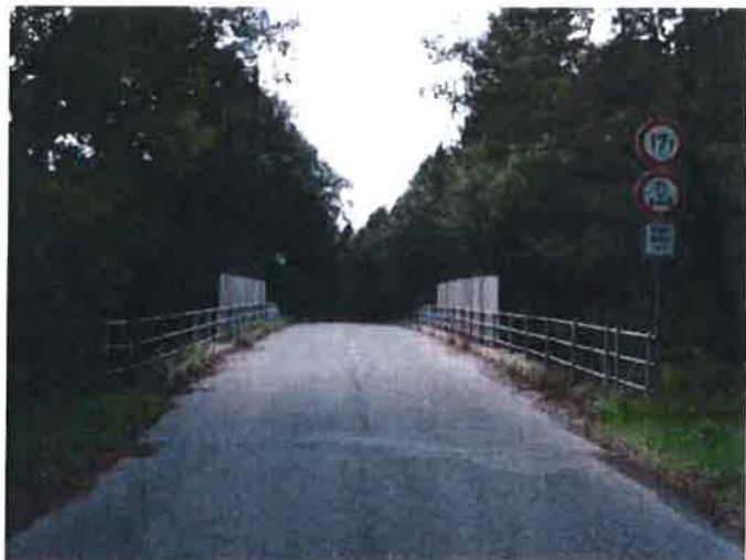
Šířkové uspořádání proti směru staničení