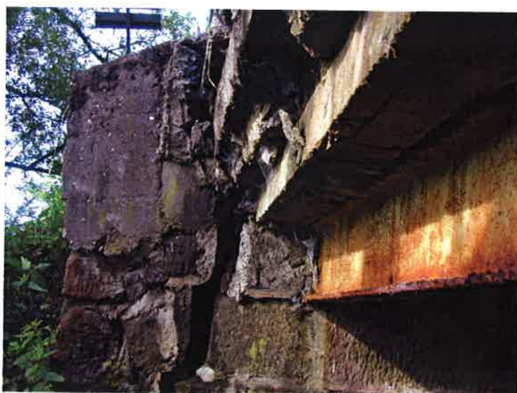
Utržené křídlo. Koroze nosníků. Průsaky ve zdivu.