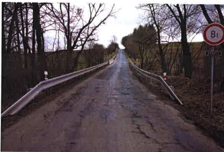
Pohled na most.