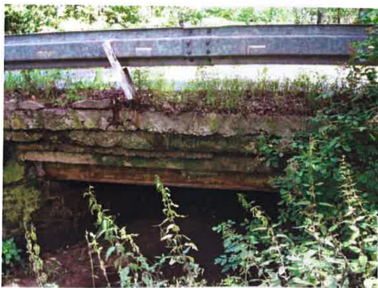
Deformovaný sloupek svodidla. Beton říms degradovaný.