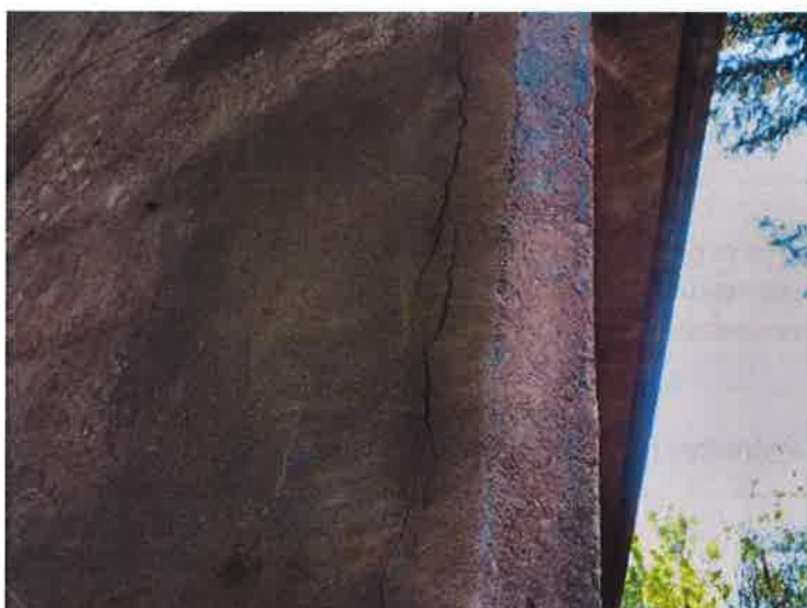
Trhlina charakteristická pro separaci krycí vrstvy nad korodující výztuží u levé stojky P2.