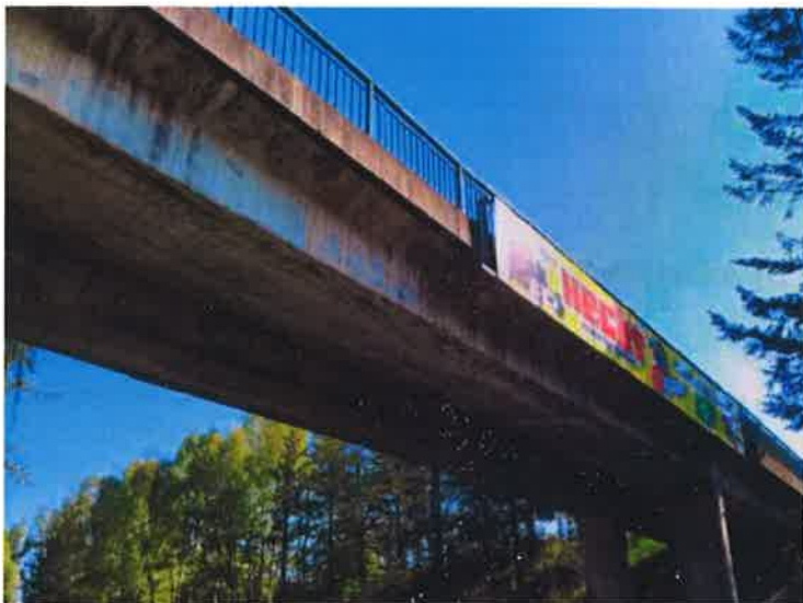
Pohled na most. Nepravidelné trhliny na levém boku levého nosníku v 2. Poli.