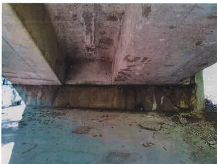
Pohled na O4 - hloubková degradace betonu v místě intenzivních průsaků dilatační sparou.