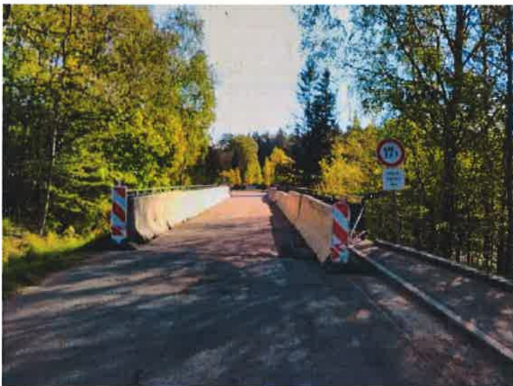
Příčné uspořádání na mostě.