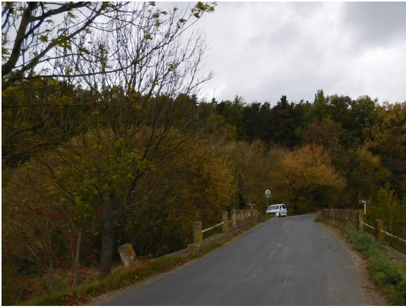
Most ev. č. 11413 - 1