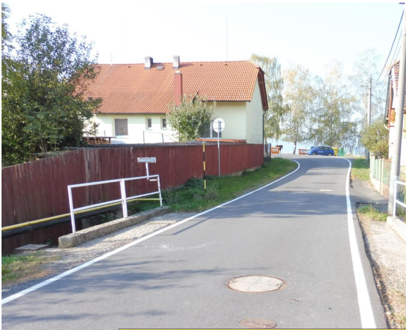
Most ev. č.11416 - 1