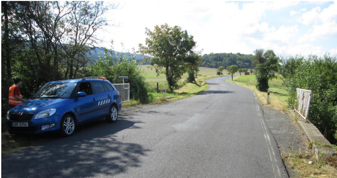
Most ev. č. 115 – 024a