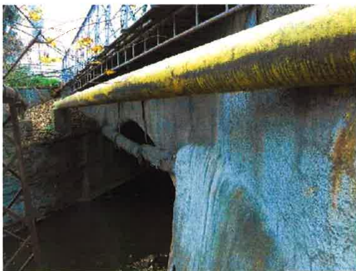
Pohled na most zprava.