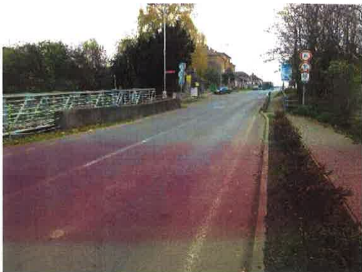
Pohled na most ve směru staničení.