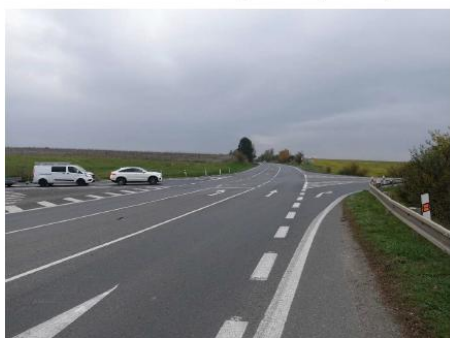
Obrázek 7 – Pohled na řešenou křižovatku z jižního ramene (silnice III/007 24).