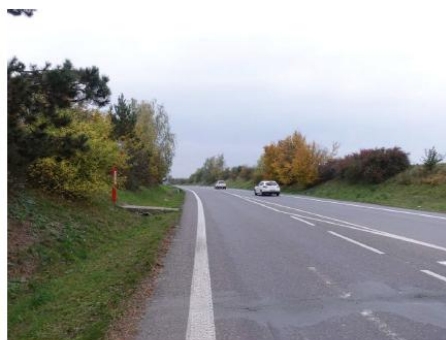
Obrázek 6 – Pohled na severní rameno (silnice III/007 24) ve směru od křižovatky.