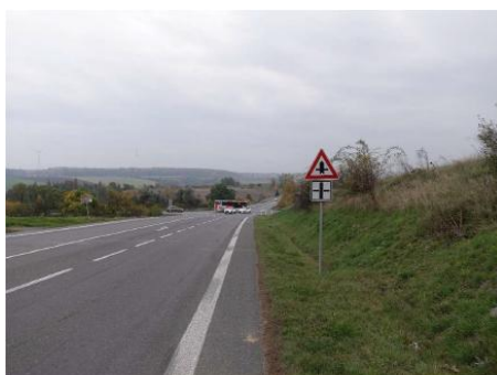
Obrázek 5 – Pohled na řešenou křižovatku ze severního ramene (silnice III/007 24).