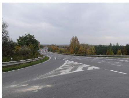
Obrázek 8 – Vzdálený pohled z východního ramene na jižní rameno (směrem k Lokalitě 2 - JIH; silnice III/007 24).