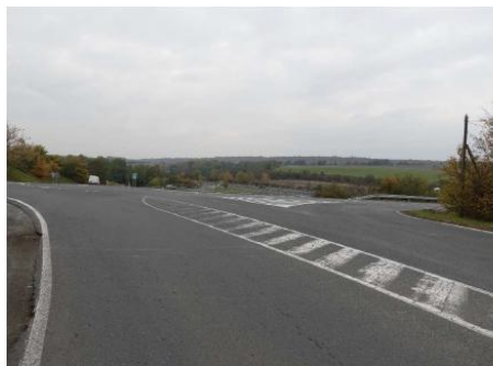
Obrázek 20 – Pohled na řešenou křižovatku z východního ramene (silnice III/007 24).