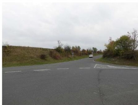
Obrázek 23 – Pohled na západní rameno (silnice III/007 25) z křižovatky.