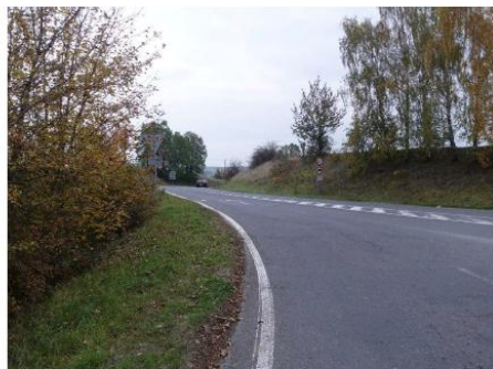
Obrázek 21 – Pohled na východní rameno (silnice III/007 24) z křižovatky.