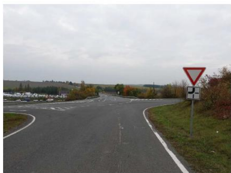
Obrázek 22 – Pohled na řešenou křižovatku z jižního ramene (silnice III/007 25).