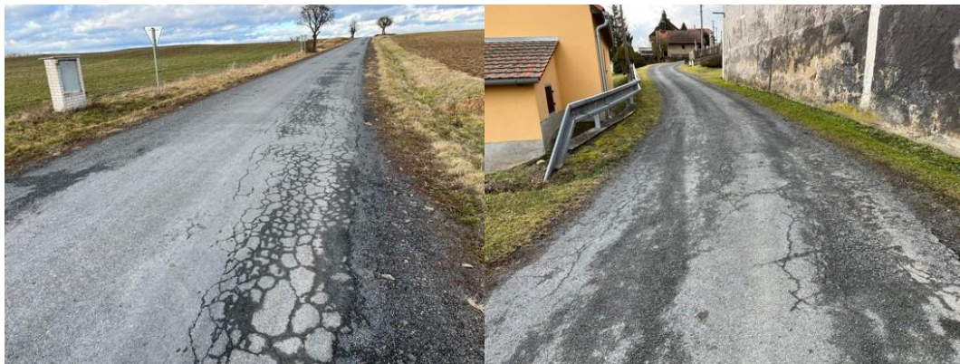
Zpracoval: Josef Raboch v únoru 2025