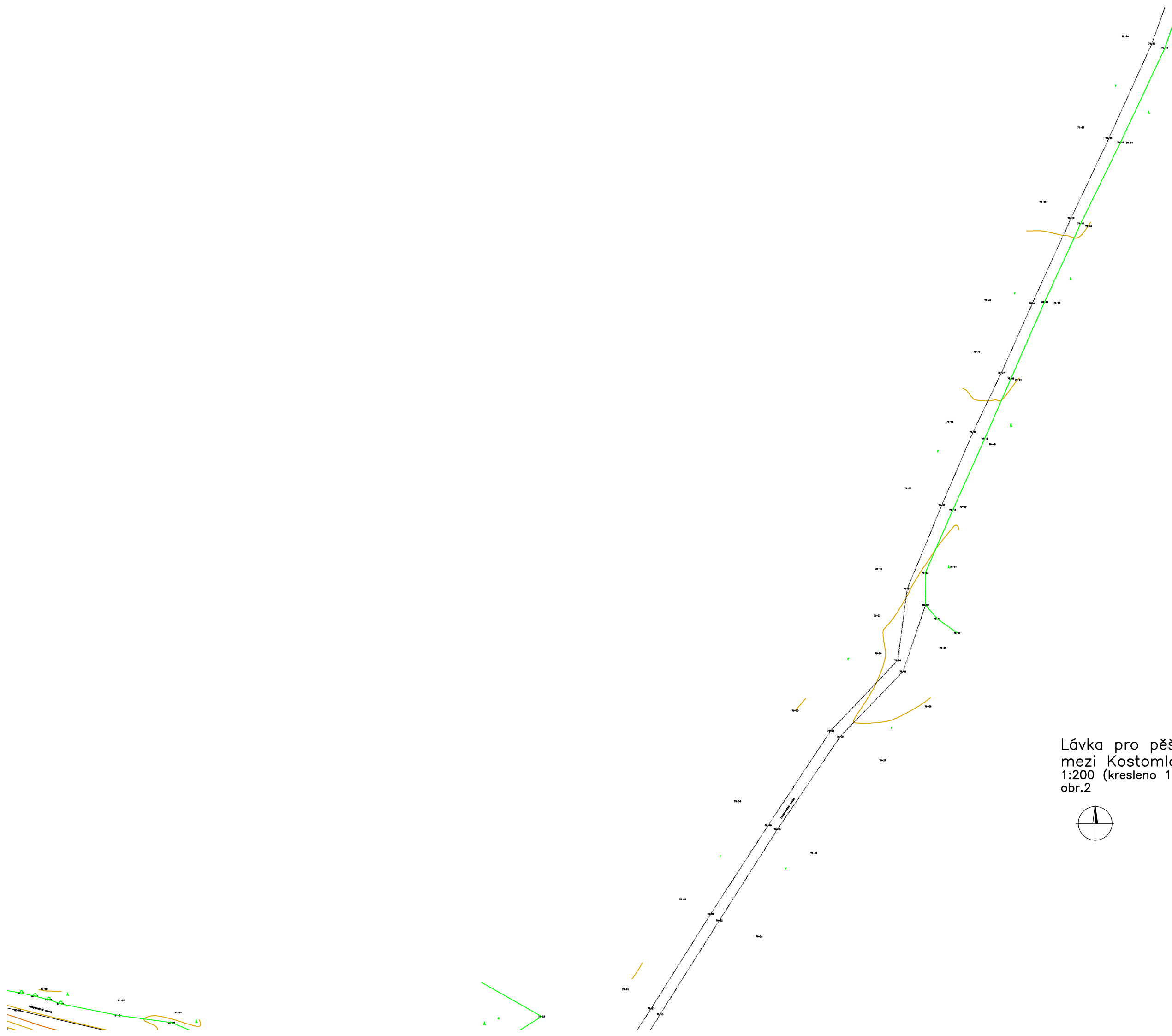
Lávka pro pěší a cyklisty přes Labe mezi Kostomlaty nad Labem a Hradištěm 1:200 (kresleno 1:1000) obr.2