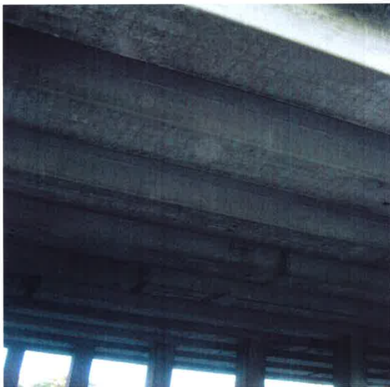
NK ve 2. poli