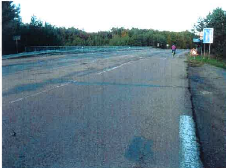
Pohled na most ve směru staničení.