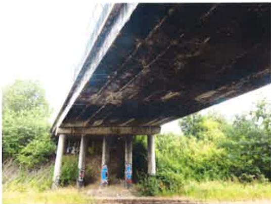
Spodní líc nosné konstrukce v hlavním poli 2.