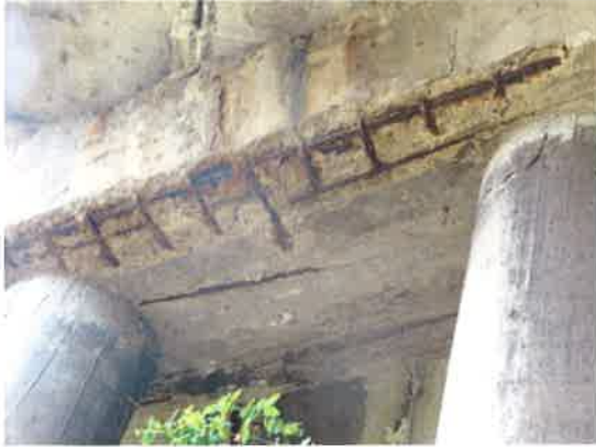
Detail zatékání na pravou stranu stativa pilíře P2, hloubková degradace betonu, silná koroze betonářské výztuže.