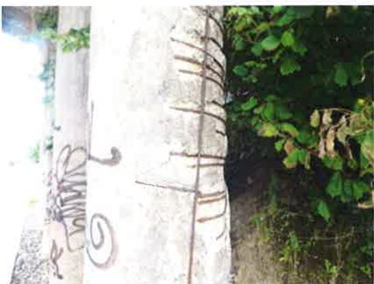
Detail separace krycí vrstvy a koroze příčné výztuže krajní levé stojky pilíře P2.