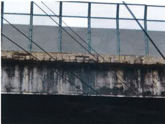
Plošně prokreslená korodující betonářská výztuž na líci římsy.