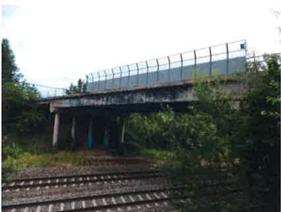
Pohled na levý bok mostu.