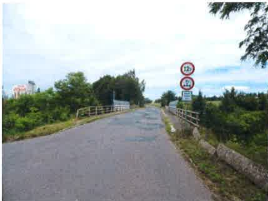
Šířkové uspořádání ve směru staničení.