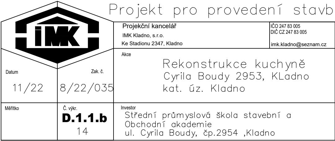
Detailní výkres podlahy Architektonicko–stavební řešení Projekt pro provedení stavby

Pozn. :Tloušťky podlahy jsou pouze orientační mohou se změnit po odstranění původní podlahy na stropní konstrukci