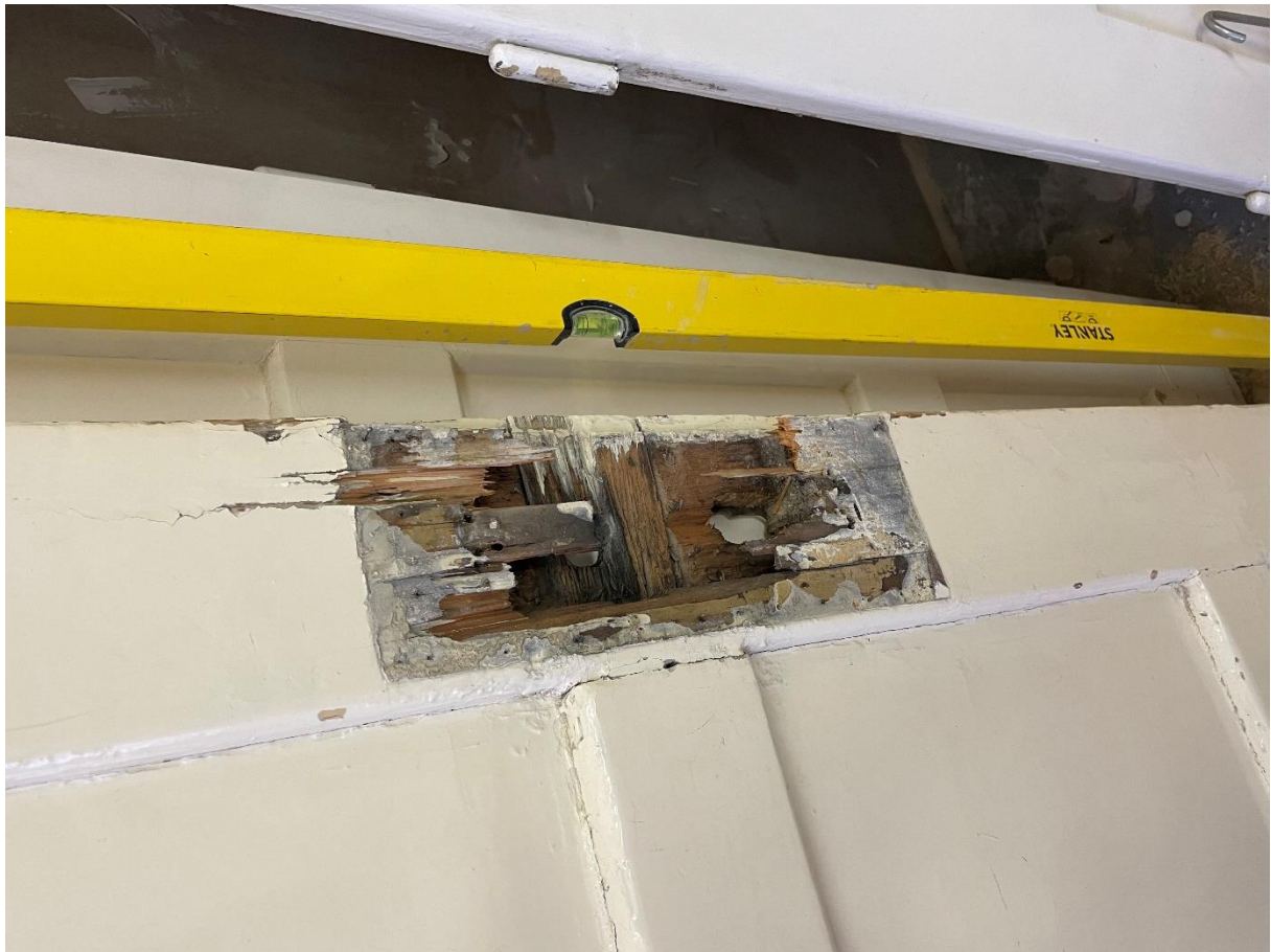
Příloha č. 2: