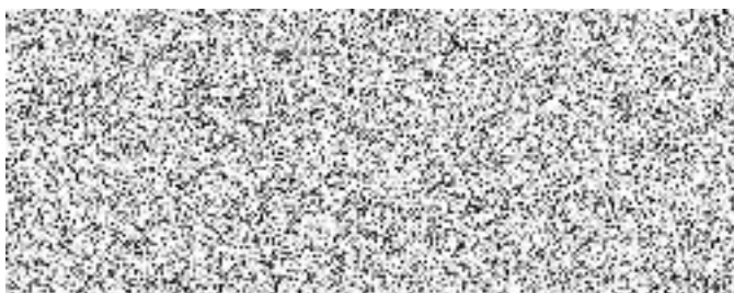
Libor Lesák radní pro oblast investic, majetku a veřejných zakázek