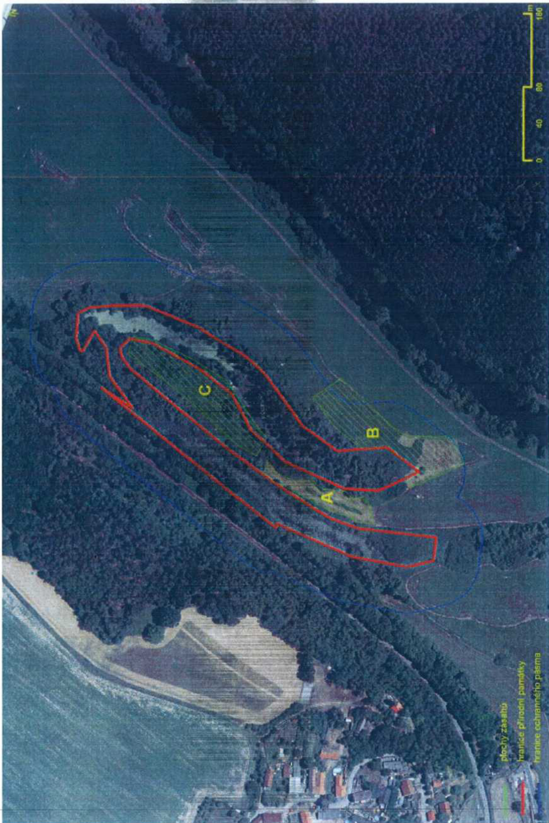
Příloha č. 2 – 2. Mapové přílohy zásahu