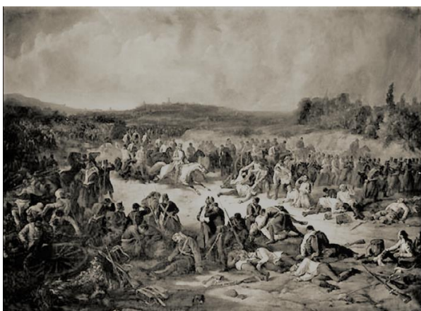
Bitva u Solferina