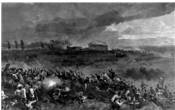
Bitva u Solferina