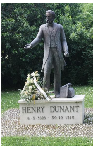
Pomník v Solferinu