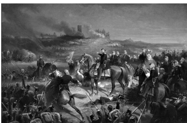
Bitva u Solferina s francouzským císařem