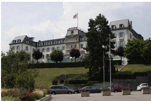
Centrála Červeného kříže