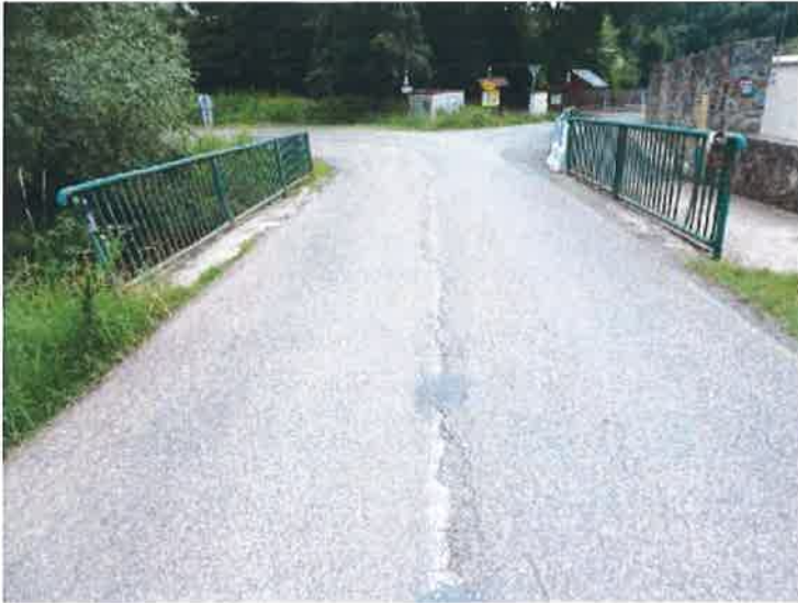
Pohled na mostní svršek ve směru staničení, otevřená podélná spára v ose vozovky, deformované zábradlí.

Veškeré navržené technologie budou dle platných norem a TP, dojde ke sjednocení a provedení VDZ v plastu, pročištění, doplnění, obnovení odvodnění, osazena veškerá nutná bezpečnostní zařízení (svodidla, zábradlí, směrové sloupky...), vyrovnání inženýrských uzávěrů.