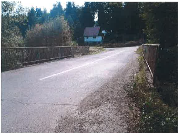
Příčné uspořádání na mostě.