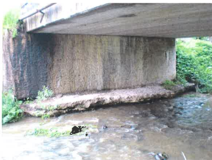
Podemletá pata opěry