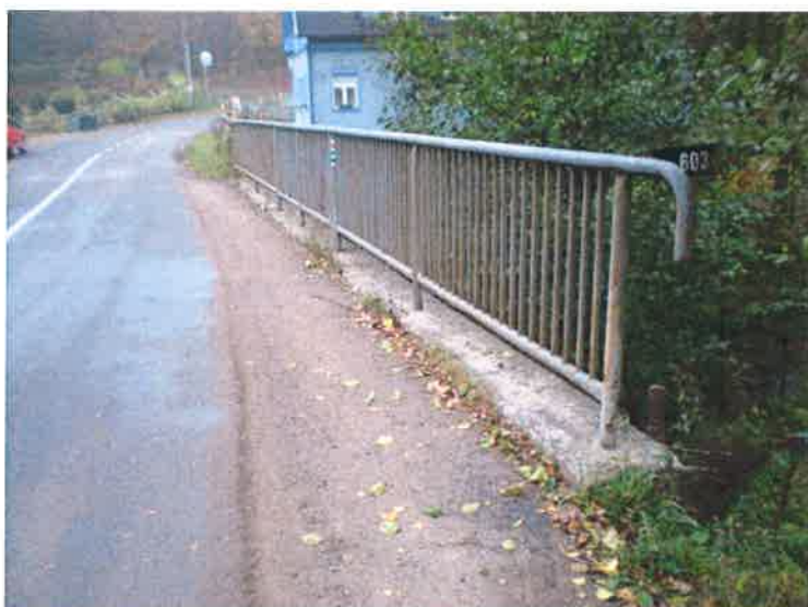
Degradace betonu říms