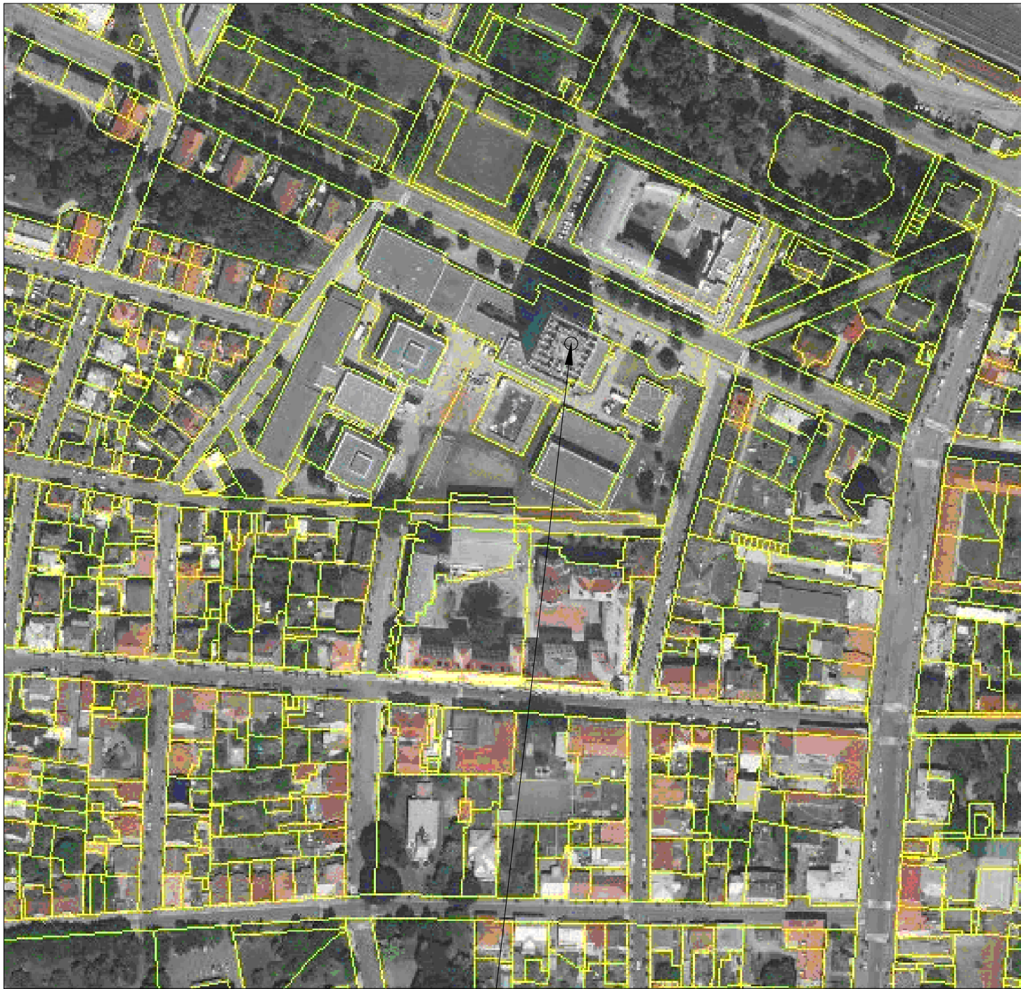
SOŠ a SOU Nymburk, V kolonii 2104, 288 02 Nymburk