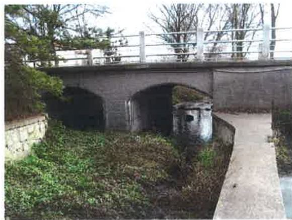
propustek na křiž. se sil. III/511