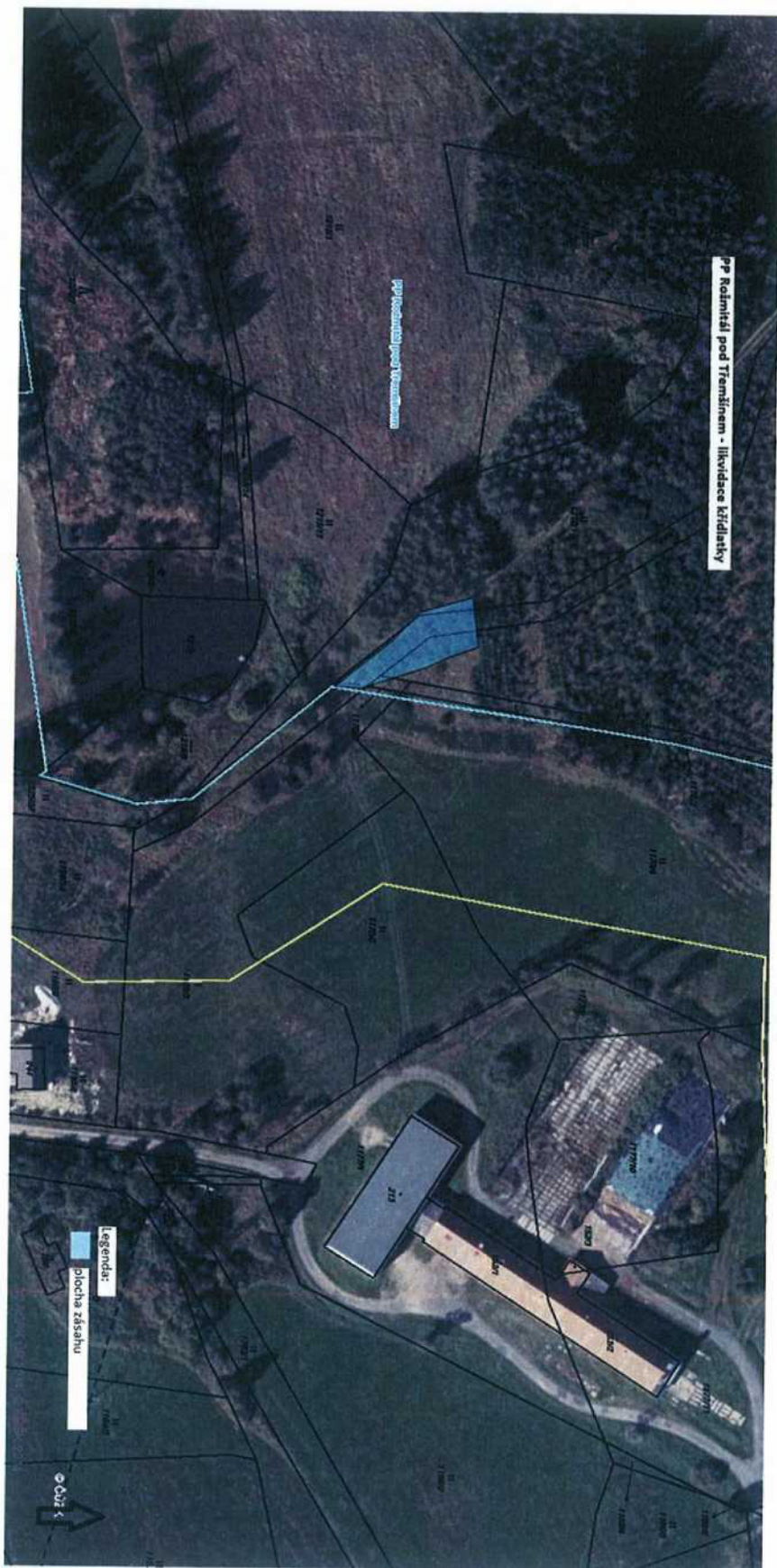
Příloha č. 2: Mapová příloha zásahu