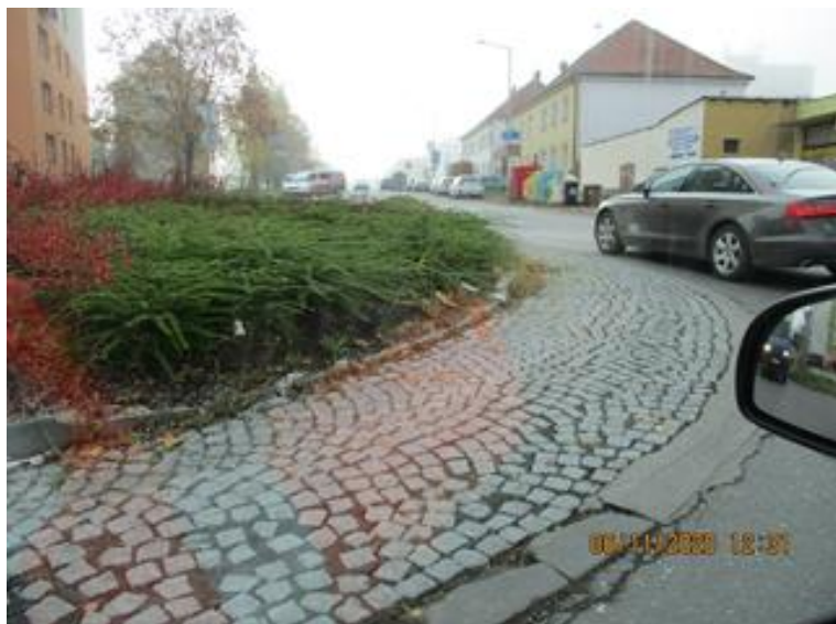
III/1256 na ZÚ v km 0,000, dlážděný prsteneček OK na II/125, obruby