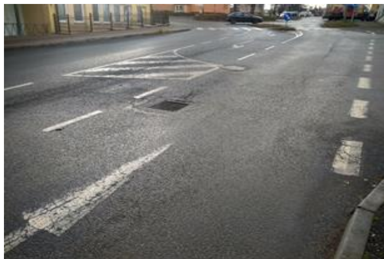
III/1256 cca v km 0,035