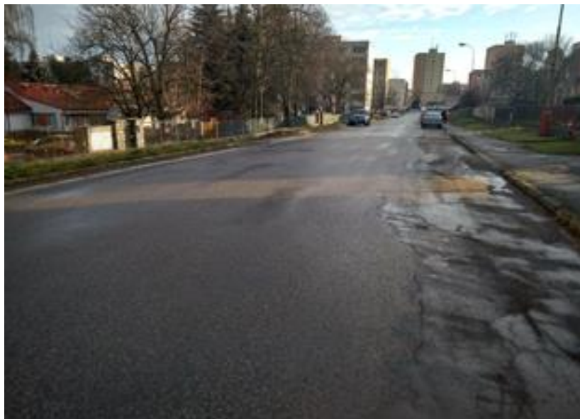
III/1256 cca v km 0,250