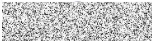
za zhotovitele Ing. Otakar Holuša, Ph.D.