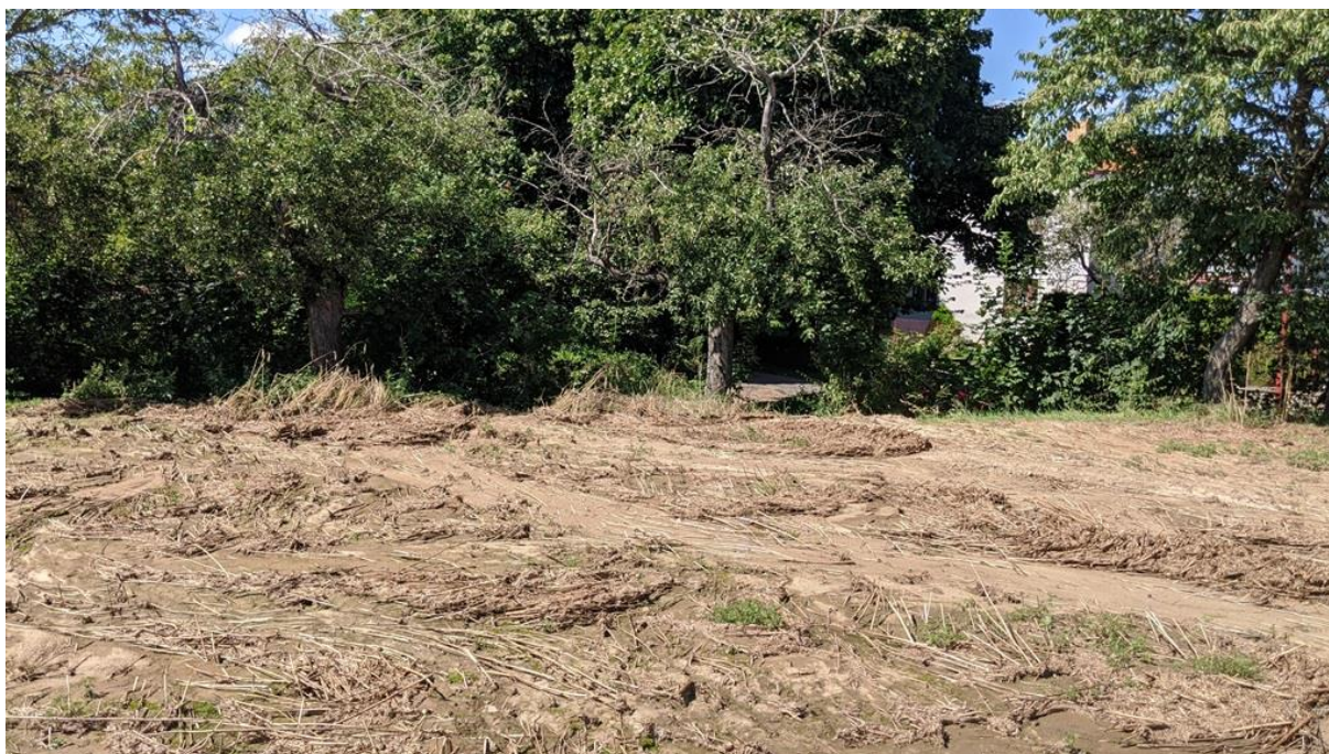
Makové pole za vsí v prostoru nad vozovkou – většinový přítok při bleskové povodni stav 20.8.2020