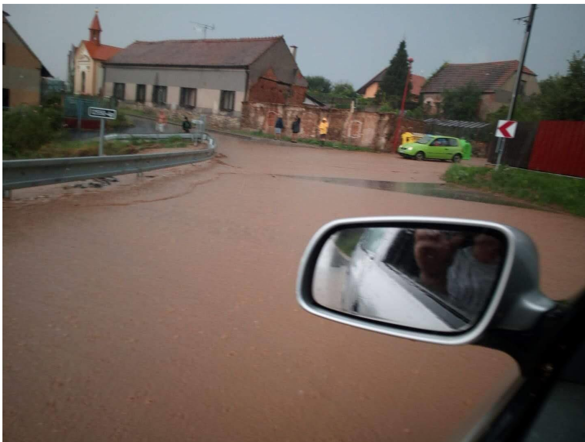
Zaplavená vozovka v oblasti propustku