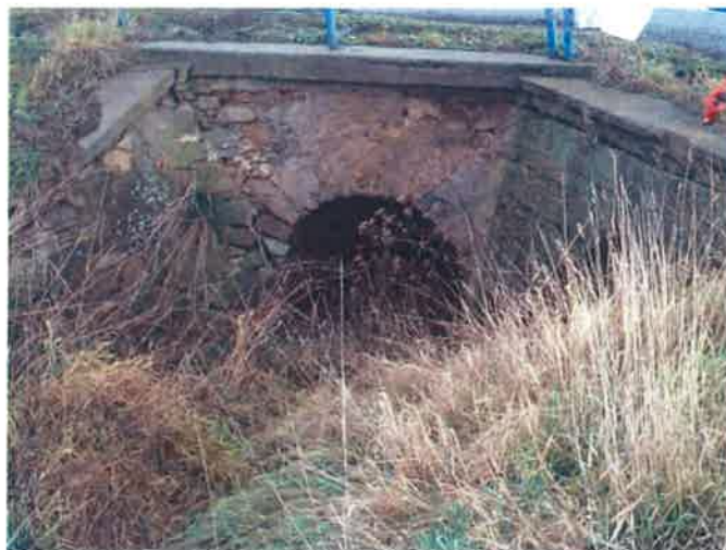
Propust v km 6,40