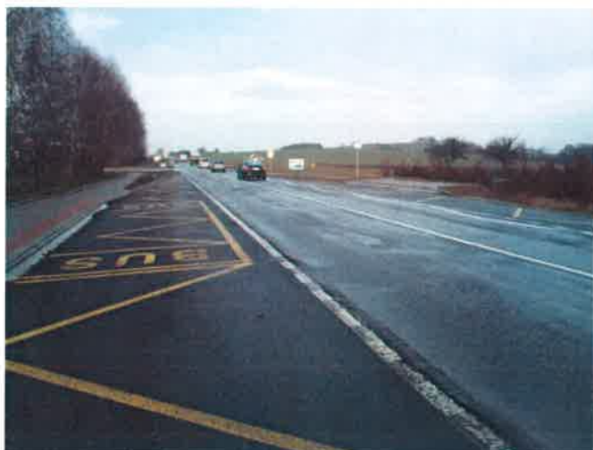
II/112 před kř. S II/111, směr Benešov