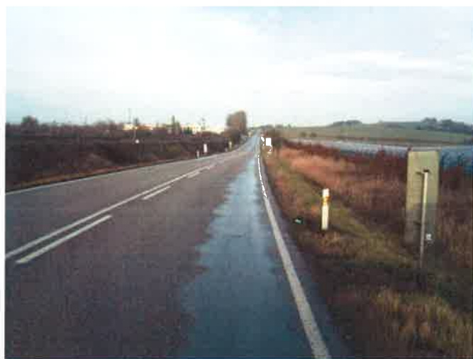
II/112, pohled proti staničení od žel. přejezdu