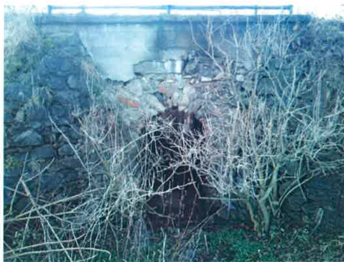
Propust v km 4,90