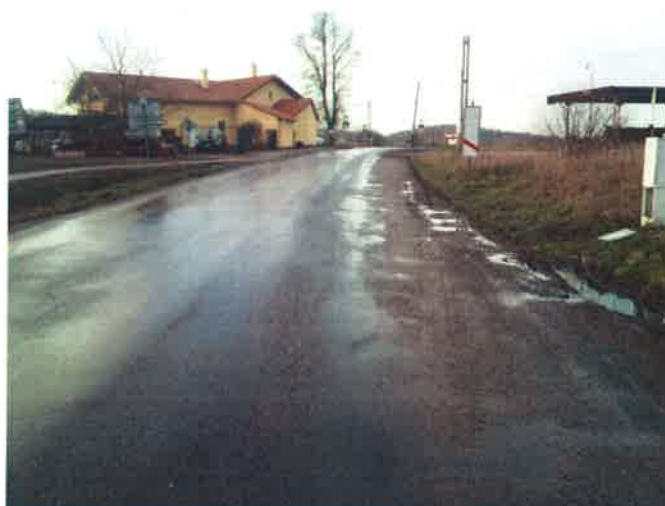
II/111 směr Budkov