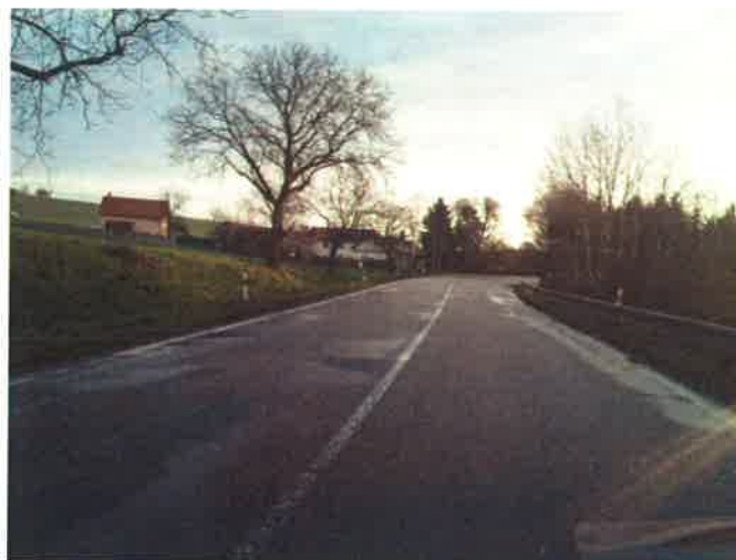
II/112 před usedlostí Nechyba