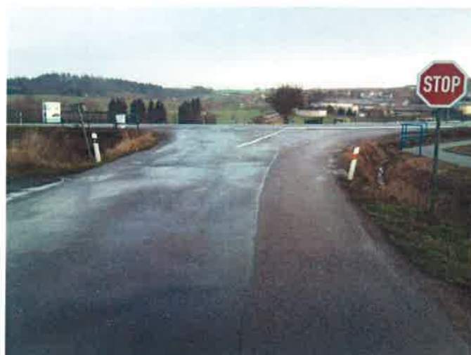
Tvar křižovatky II/111 x II/112