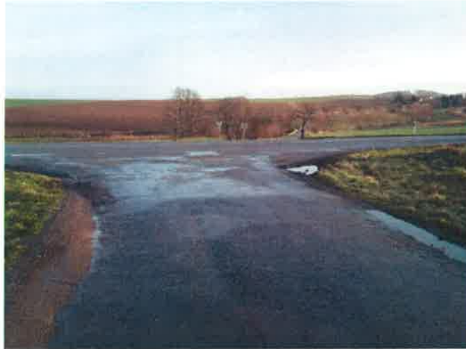
Křížovatka silnic II/112 a III/1121