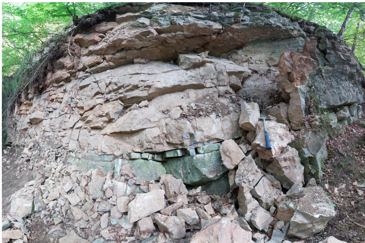
Foto 4 Odlučná hrana, odkud došlo k uvolnění horninových hmot. Zřetelně je vidět, že vrstvy vápenců jsou sub-horizontálně ukloněny pod úhlem cca 10° a při povrchu nepravidelně rozpukané příčnými extenzními trhlinami. V důsledku takového strukturně-tektonického plánu horninového masivu dochází v důsledku působení eroze a zvětrávání ke vzniku poměrně výrazných skalních převisů.