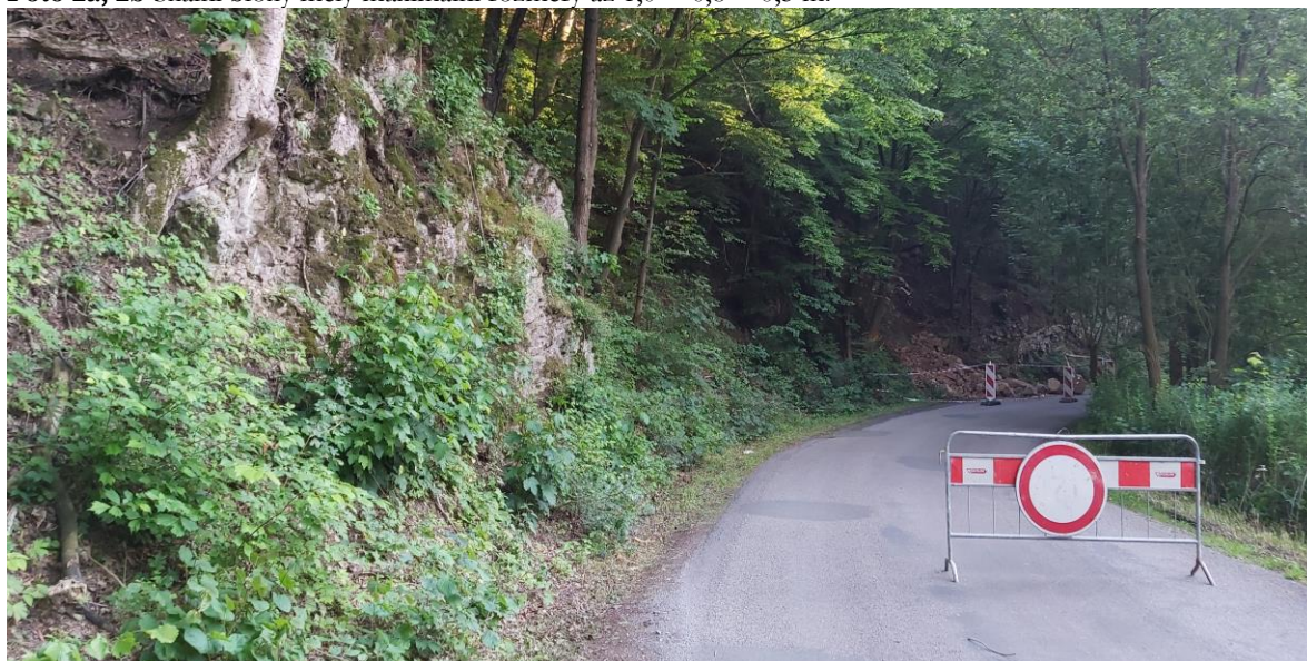
Foto 3 S ohledem na bezpečnost došlo bezprostředně po skalním řízení k uzavření silnice III/11515.