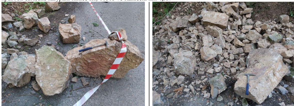
Foto 2a, 2b Skalní bloky měly maximální rozměry až 1,0 × 0,8 × 0,5 m.