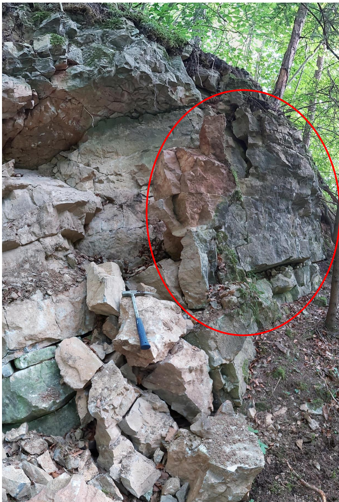
Foto 6 V místě, kde došlo 21. června 2020 ke zřícení horninových hmot, se nacházejí další viditelně od masivu oddělené horninové bloky a nestabilní převislé části ( červená elipsa ) – viz též foto 4.