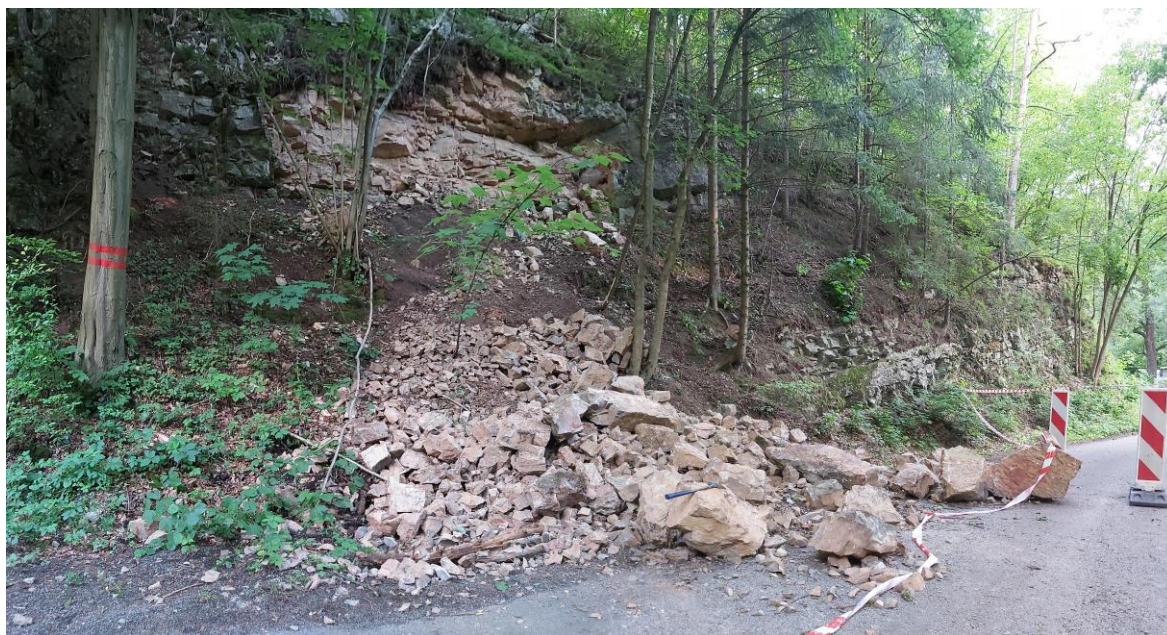
Foto 1 Během svahového pohybu se dne 21. června 2020 uvolnilo přibližně 5 m 3 horninového materiálu, který způsobil částečné zasypaní silnice III/11515 ve staničení km 4,33.