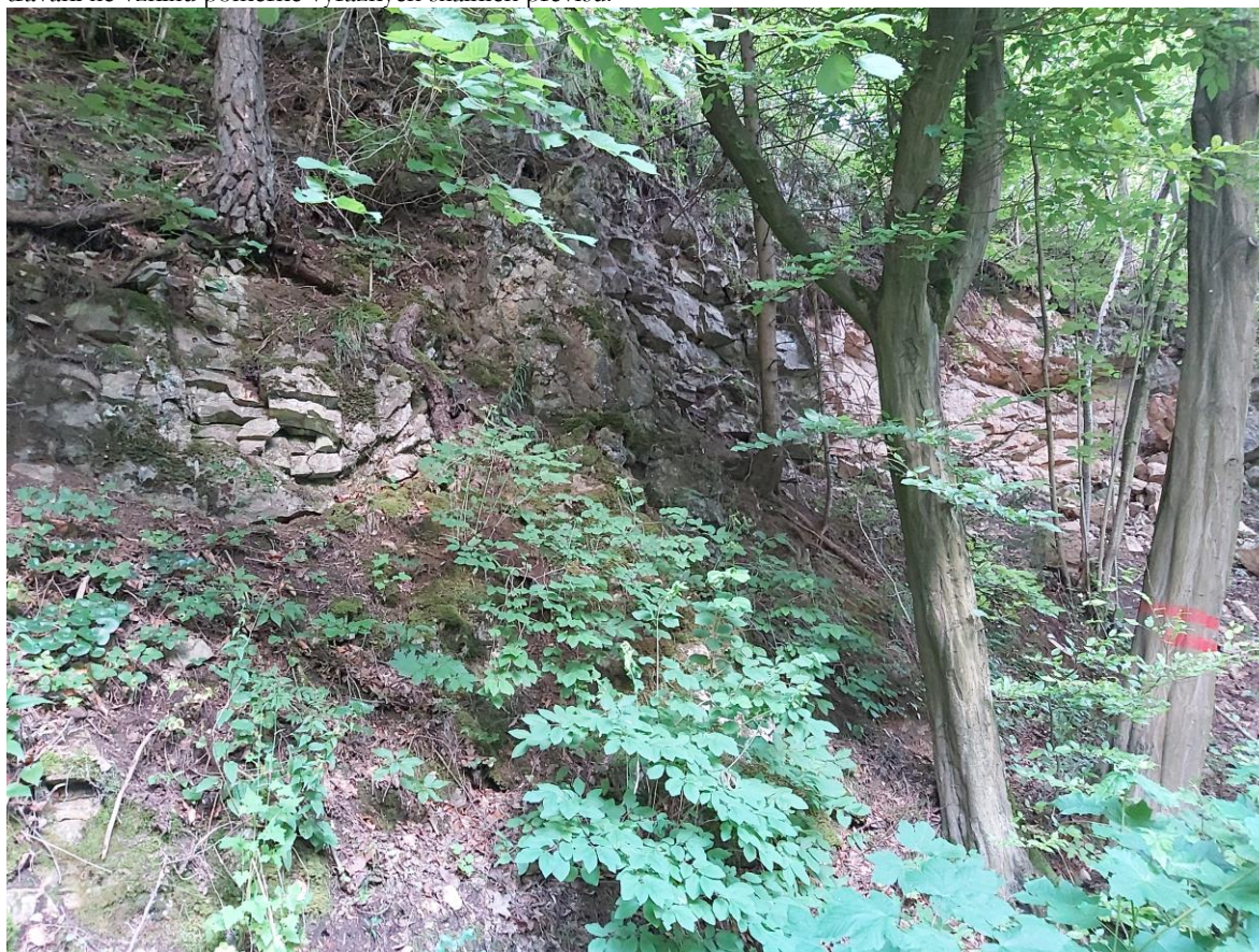
Foto 5 Skalní svah je v hojné míře porostlý náletovou vegetací, jejíž kořenový systém má na stabilitu masivu negativní vliv.