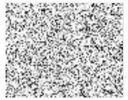
Příloha č. 3 Ilustrační foto stojanu