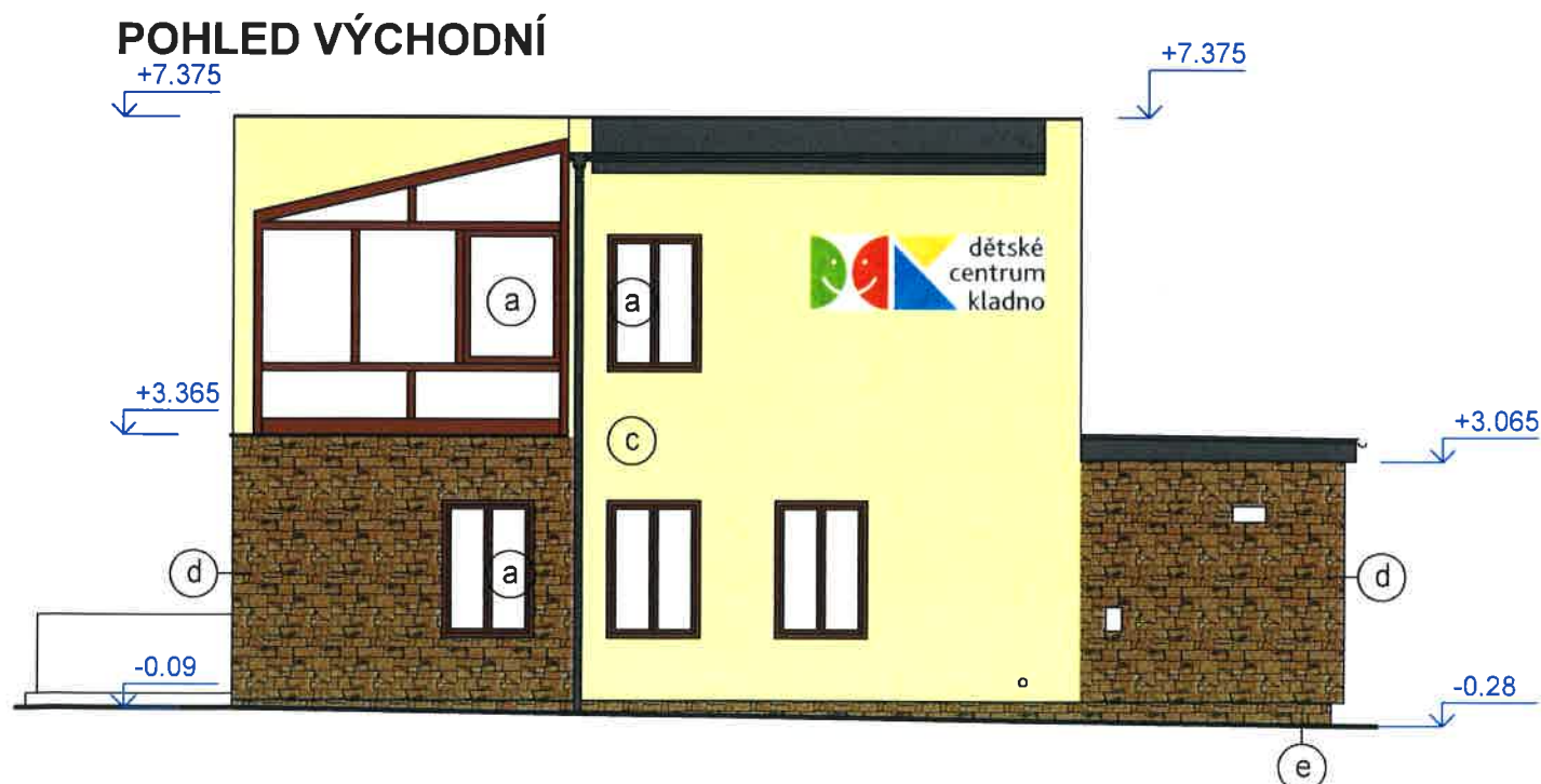
STÁVAJÍCÍ VÝCHODNÍ POHLED