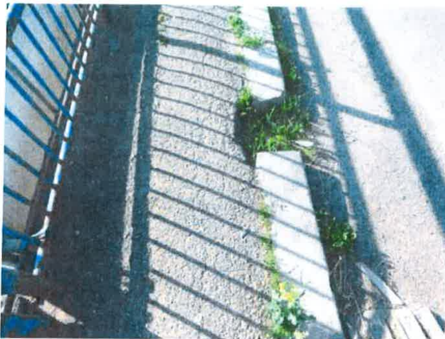
Zanesený a zarostlý odvodňovač na levé straně vozovky. Soubor z Nahrán