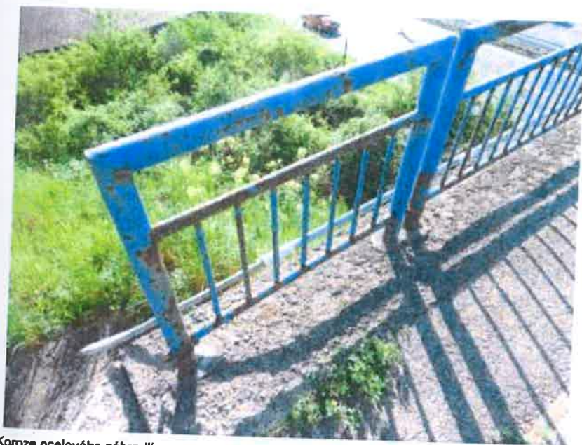
Koroze ocelového zábradlí. Soubor z Nahrán