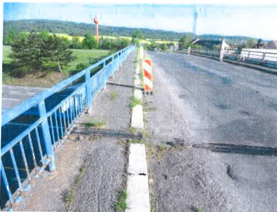
Vegetace uchycená podél obrubníku a nánosy nečistot na krají vozovky. Soubor z Nahrán