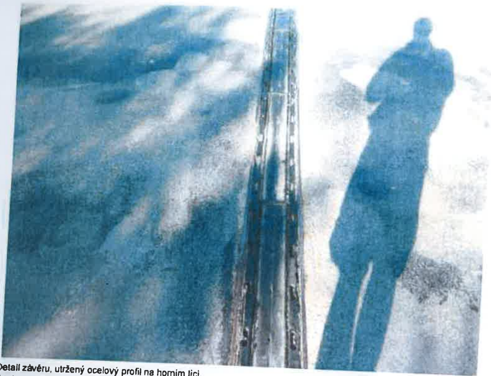
Detail závěru, utržený ocelový profil na homim lici Soubor z Nahrán