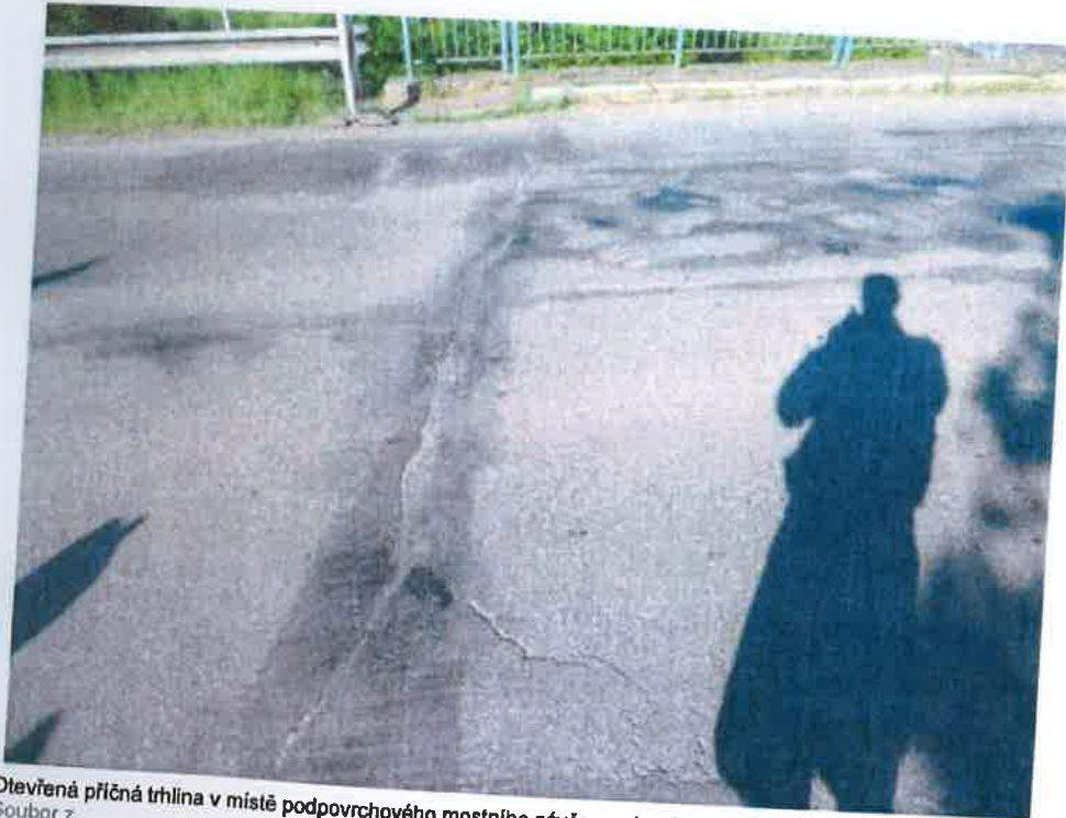
Otevřená příčná trhлина v místě podpovrchového mostního závěru nad opěrou OP1. Soubor z Nahrán