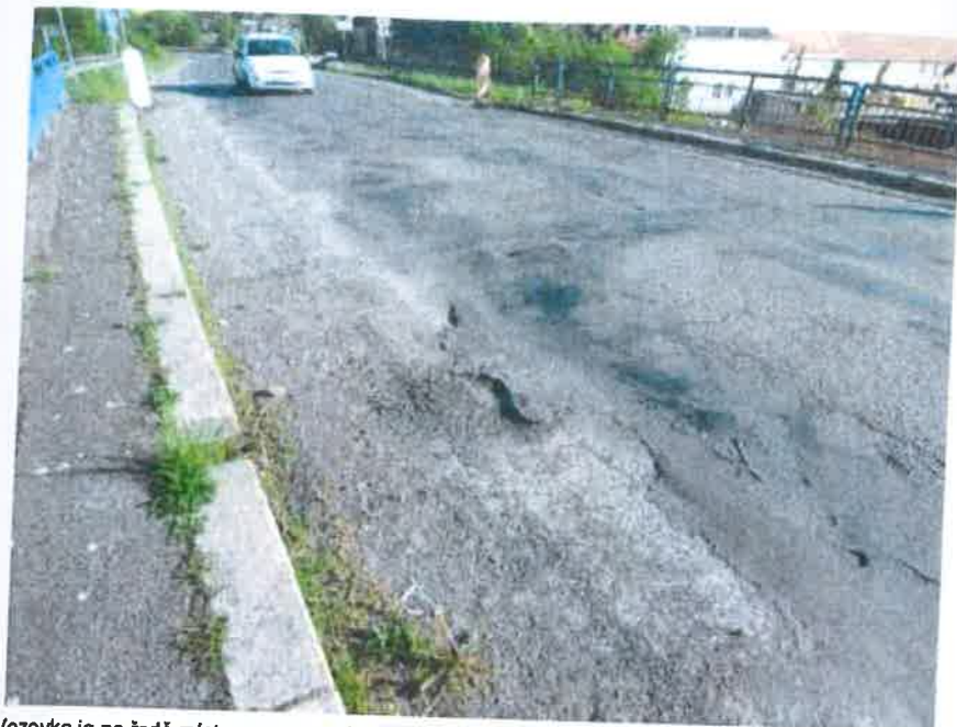
Vozovka je na řadě míst vyspravovaná, je deformovaná, tvoří se výtluky Soubor z Nahrán