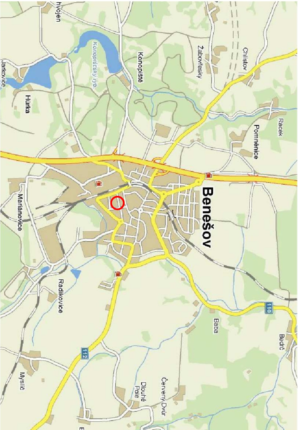
SITUAČNÍ VÝKRES 1:47 000