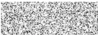
Milan Slavíček ředitel správy pojištění