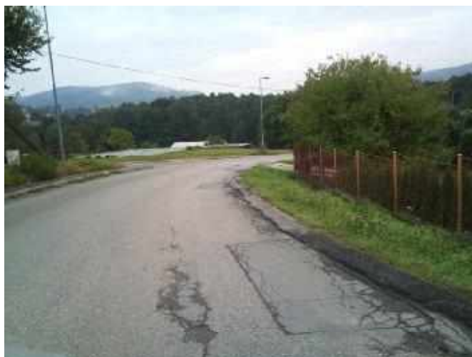
III/12148 – doplnění obrubníků