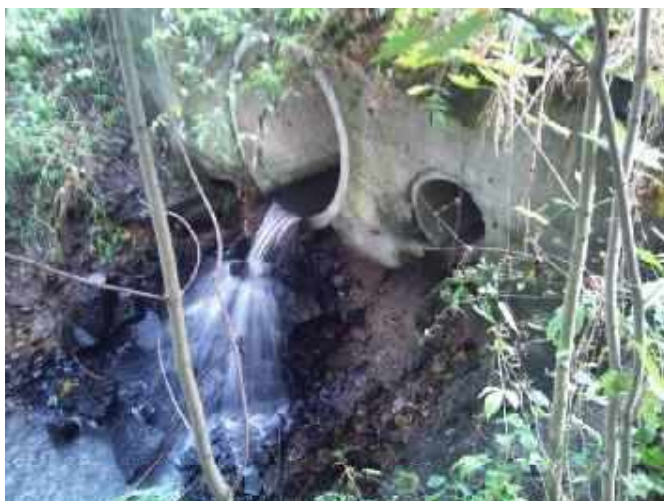
III/12148 – výtok propustu DN 1000