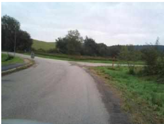
Kř. III/12148 x II/121