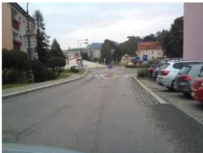
II/121 ul. Husova – konec úseku