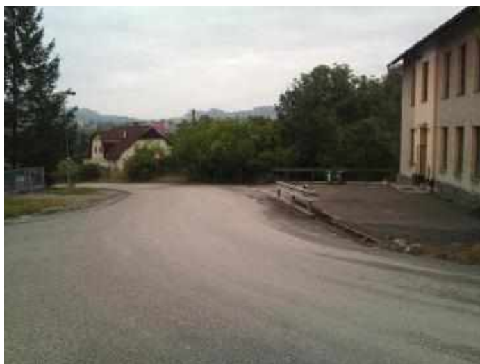
Začátek úseku – III/12148 u nádraží