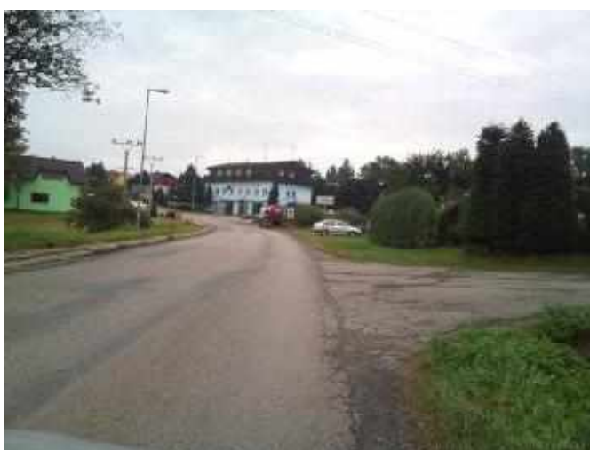
II/121 ul. Husova