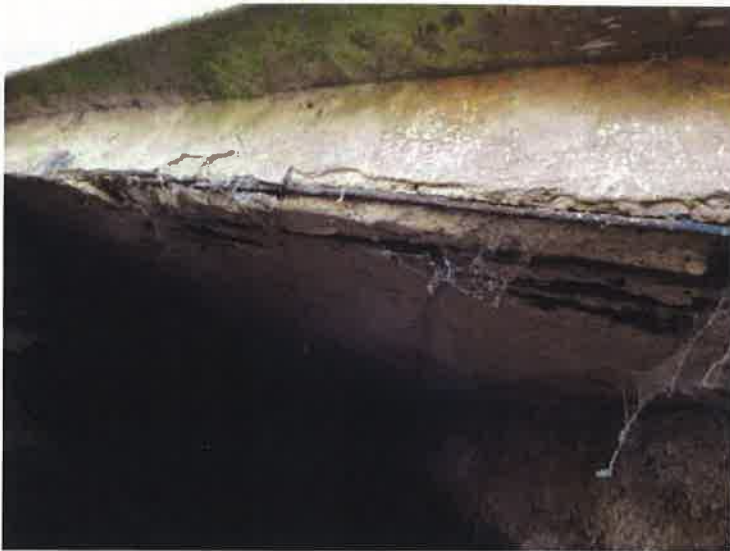
Obnažená korodující výztuž vpravo na nosné konstrukci