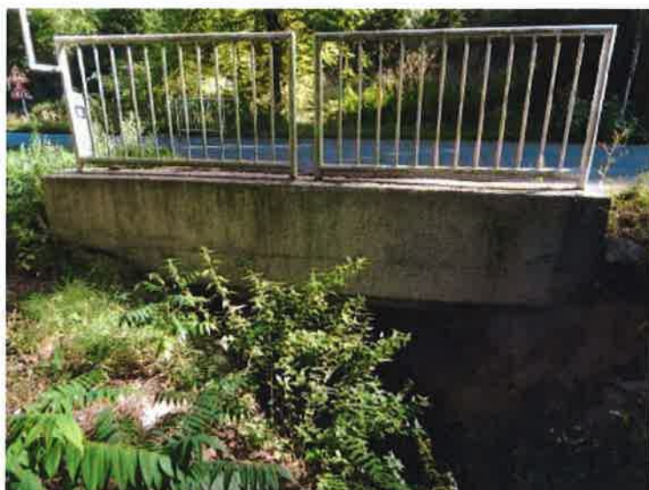
Pohled na pravou stranu mostu