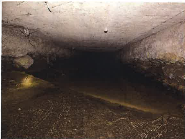
Pohled do mostního otvoru zprava