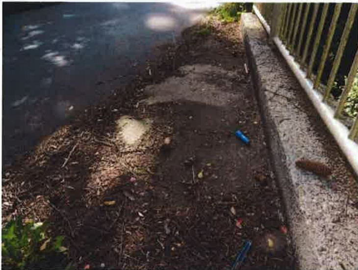
Nečistoty na mostním svršku