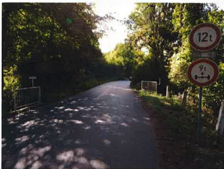
Pohled na most ve směru staničení