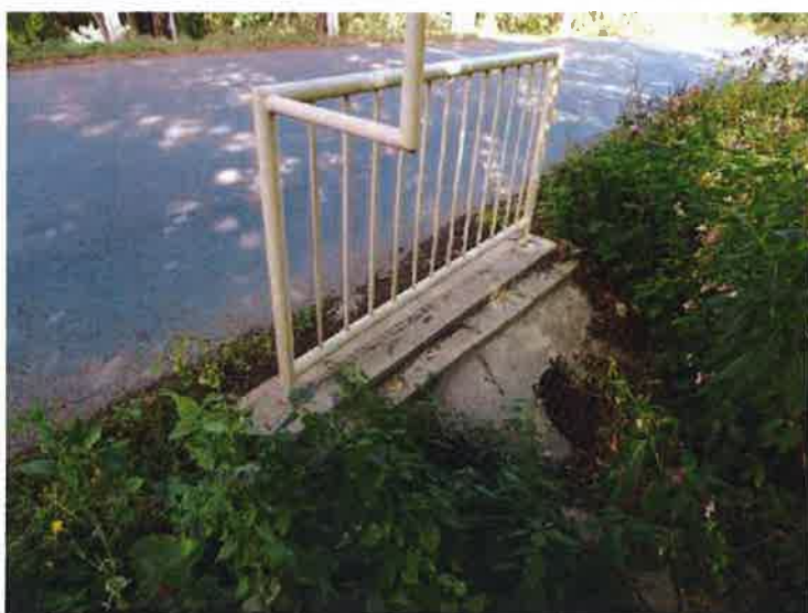
Pohled na levou stranu mostu