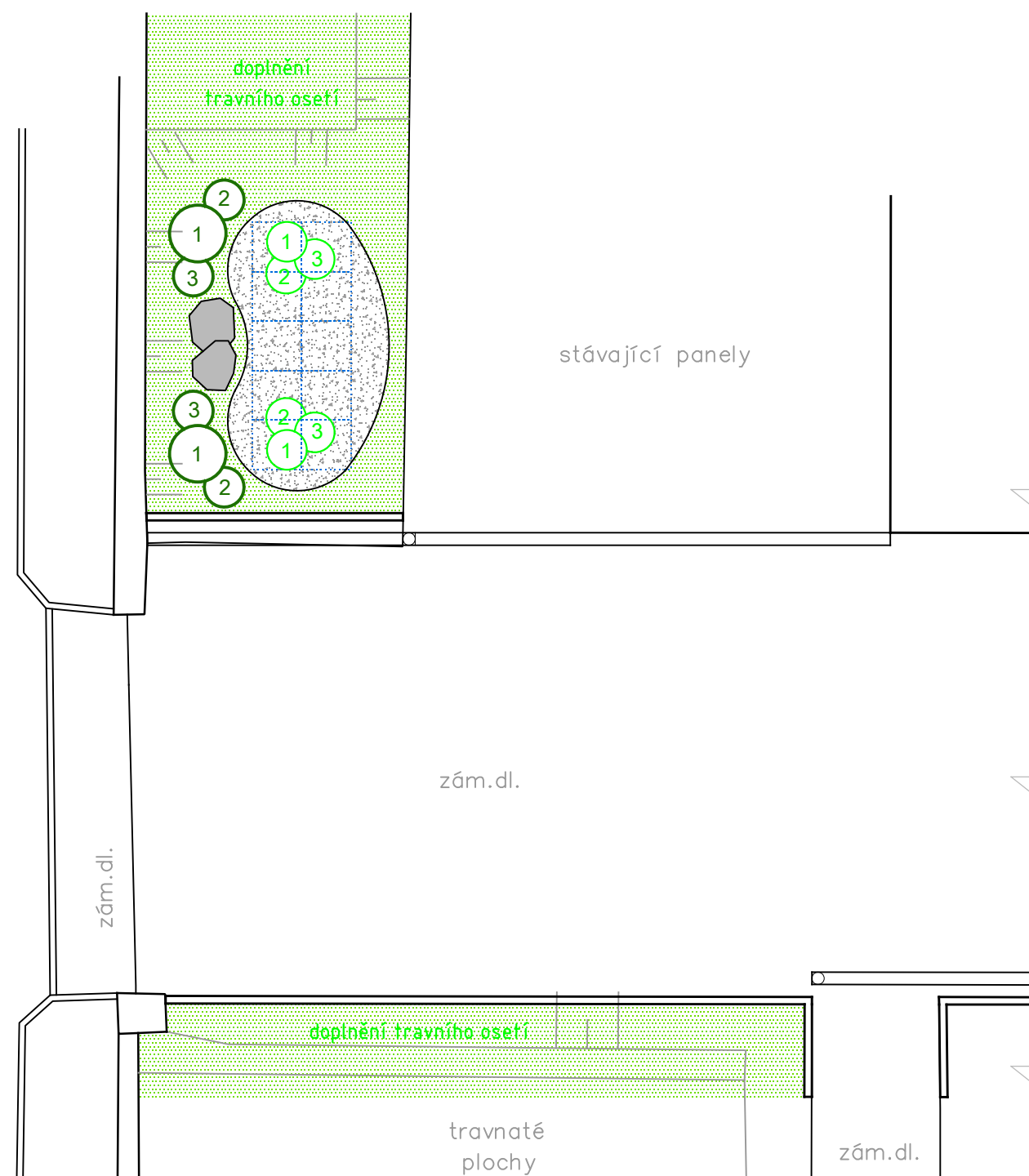
lokalita zasakování č.2