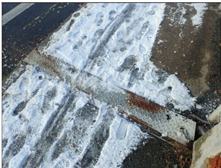
Mostní závěr nad O1, L chodníkový úsek.

Intenzivní koroze krajních profilů v dilatační mezeře, postoupila do zámků těsnícího profilu.