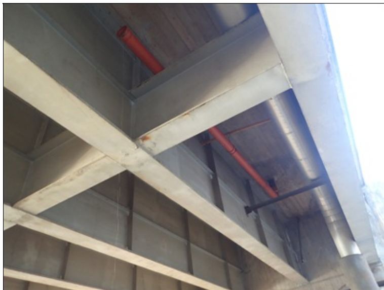
Pole 1, pohled NK, u L boku, úsek před O1.