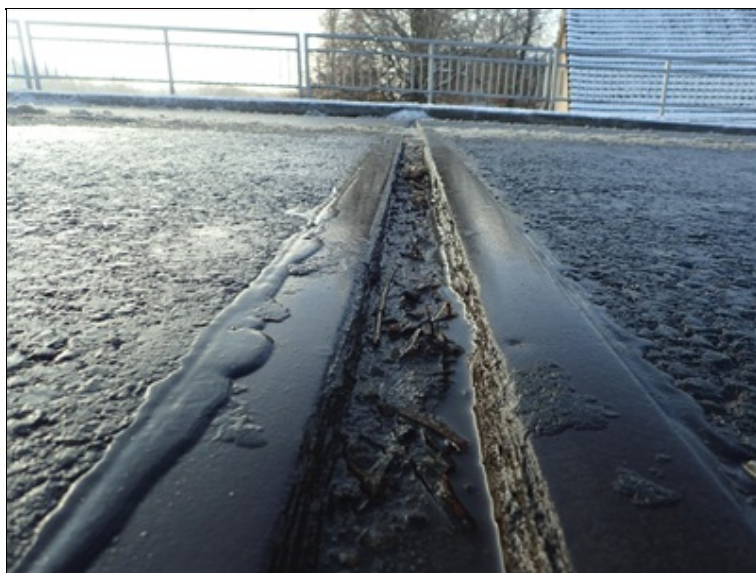
Mostní závěr nad O1, detail přejezdné plochy.

Při aktuální teplotě NK = +1^{\circ}\text{C} naměřena na mostním závěru nad O1 v P jízdním pruhu kolmá šířka dilatační spáry = 52,2 mm. Pro normovou mezní teplotu spřažené NK a uvažovanou vzdálenost k pevnému bodu cca 112 m (na O4) dojde k rozevření spáry o cca 28mm, případně k sevření o cca 52 mm, kapacita zařízení v 12/2018 nevyhovuje.