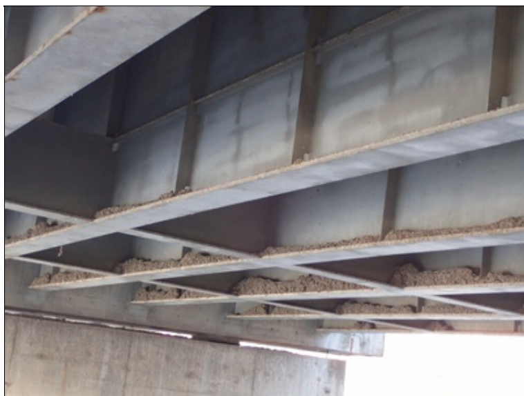
Pole 3, pohled NK, úsek za pilířem P3.