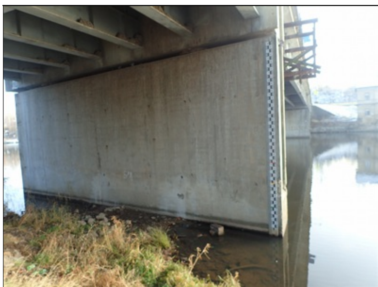
Pilíř P2 z P strany mostu.