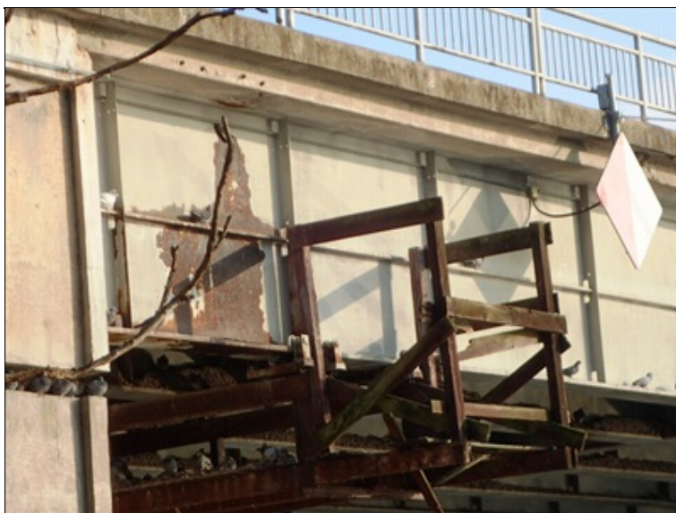
Bok P krajního nosníku, úsek za P2.