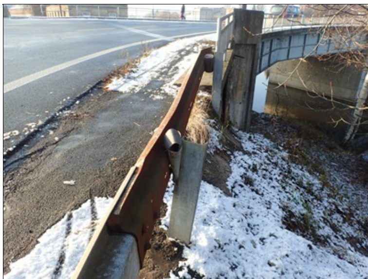
Předpolí opěry O4, za L křídlem

Některé z doplněných PVC ležatých svodů posunuty větrem, voda opět vytéká na ocel. NK.