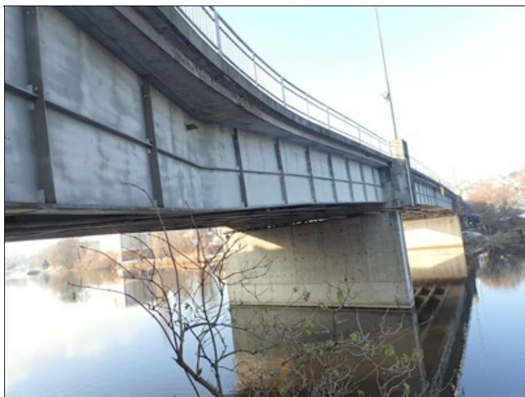
L bok mostu, pole 3, 2, pilíř P3.