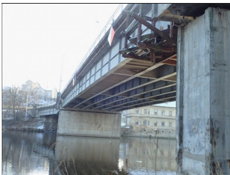
L bok mostu, pole 2, pilíř P3.