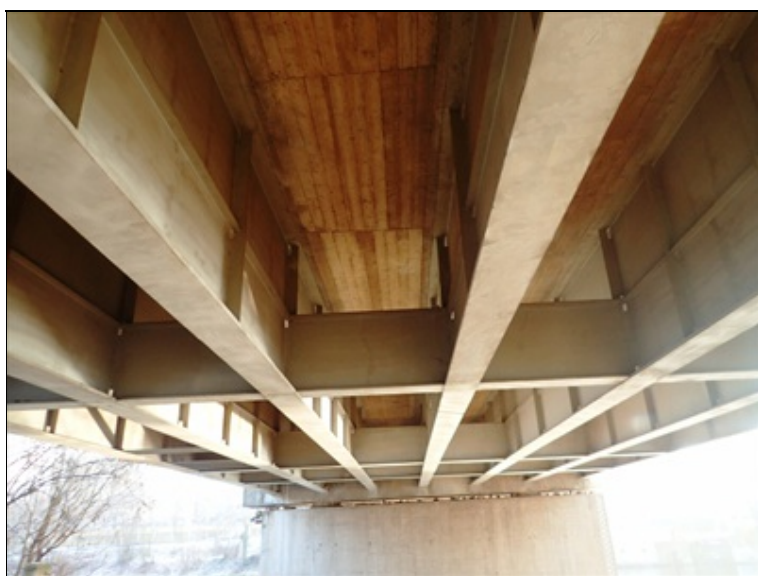
Pole 1, podhled NK, střední část, směrem k P2.

Ložiska na opěrách intenzivně korodují. Kontrola je vzhledem k nepřístupnosti i konstrukčnímu uspořádání velmi omezená.