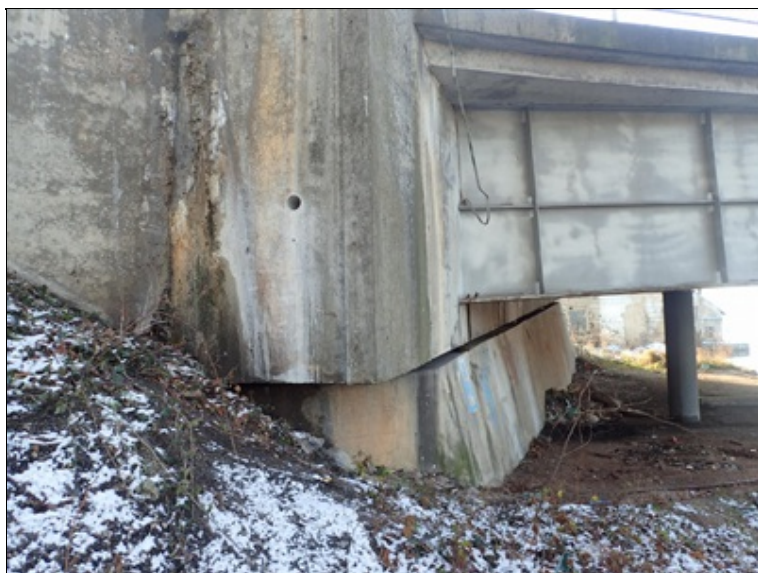
L bok mostu, konec pole 3, opěra O4.