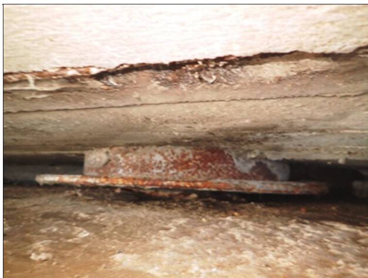
Opěra O1, P ložisko.

Následkem zatékání mostními závěry degradace betonu a koroze výztuže na podhledu obou koncových příčníků. U příčníků nad pilíři odtrhávání krycí vrstvy z korodující výztuže patrné pod oběma chodníkovými úseky.