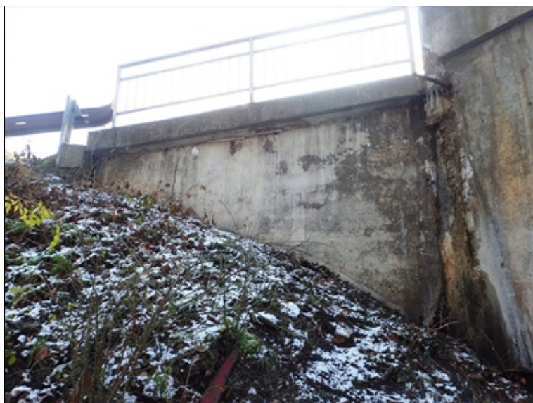
Líc L křídla opěry O4.

Na úložný práh obou opěr dlouhodobě zatéká dilatační spárou s NK, nejvíce pod chodníky. V krajních úsecích dříku v okamžiku prohlídky tmavé i mokré pruhy.