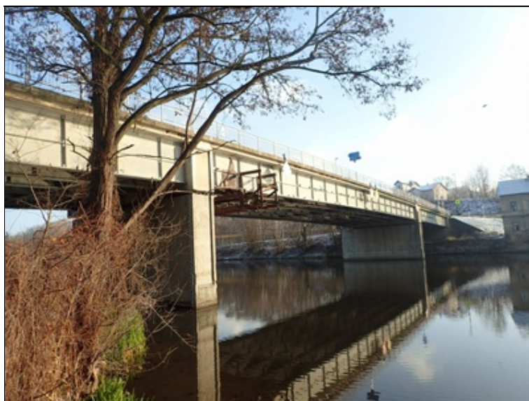
P bok mostu, pole 1, 2, pilíř P2.