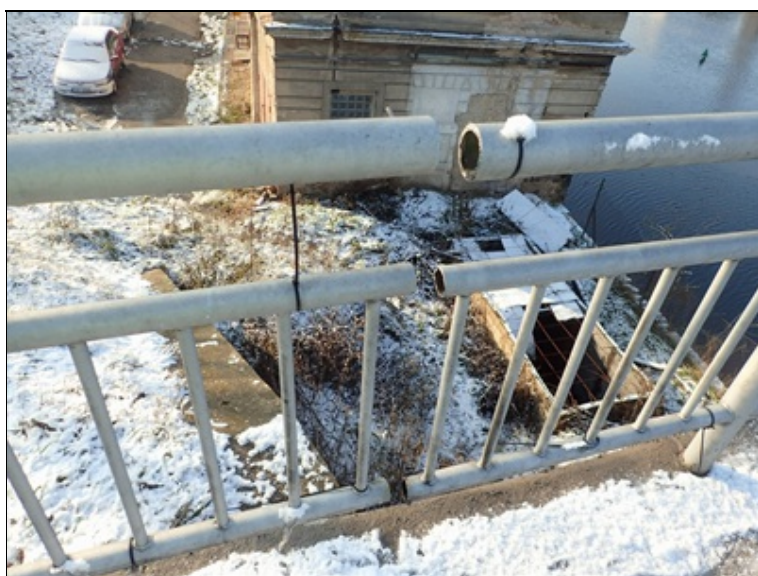
Detail dilatační mezery P zábradlí nad O4.

Na mostní konstrukci nevyplněné otvory po odběru vzorků betonu a provádění sond k výztuži.