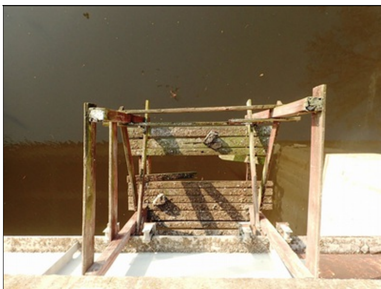
P bok mostu, pole 2, pohled dolů na revizní lávku.

Svodidlo poškozené nárazem vozidla, celoplošná koroze, nedostatečný počet sloupků.