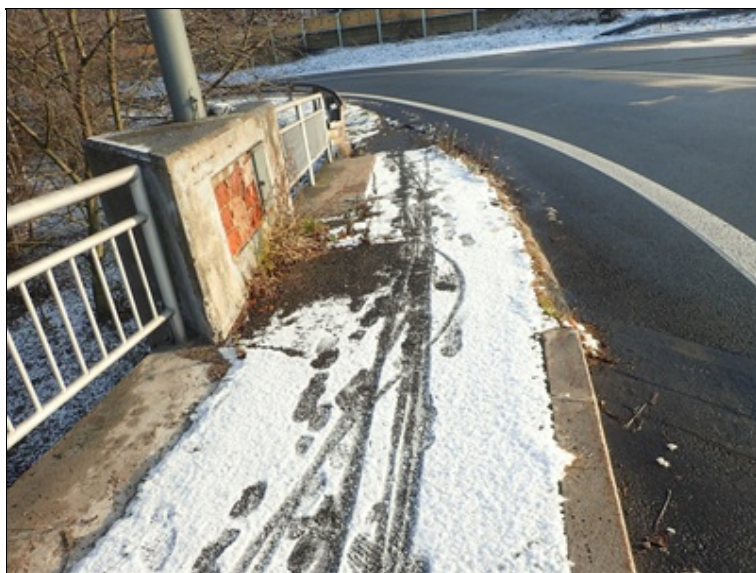
L chodník v linii EMZ nad O4.