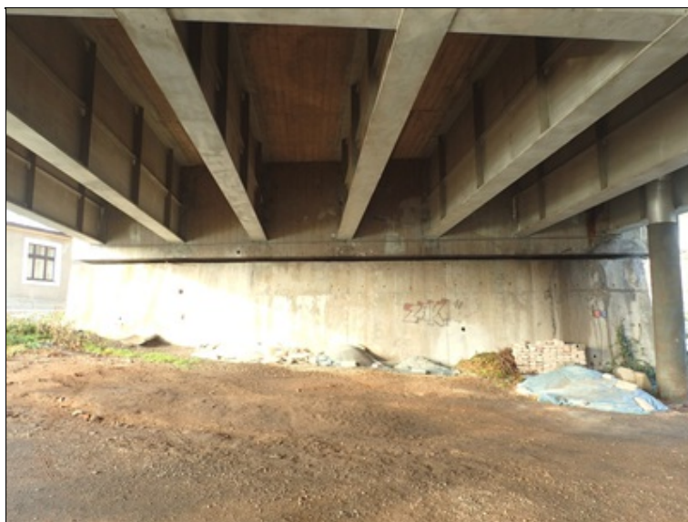
Líc O1, podhled NK v poli 1.

Podle průsaků selhává hydroizolace v ukončení na římsy u mostních závěrů, projevuje se zde absence odvodnění jejího povrchu