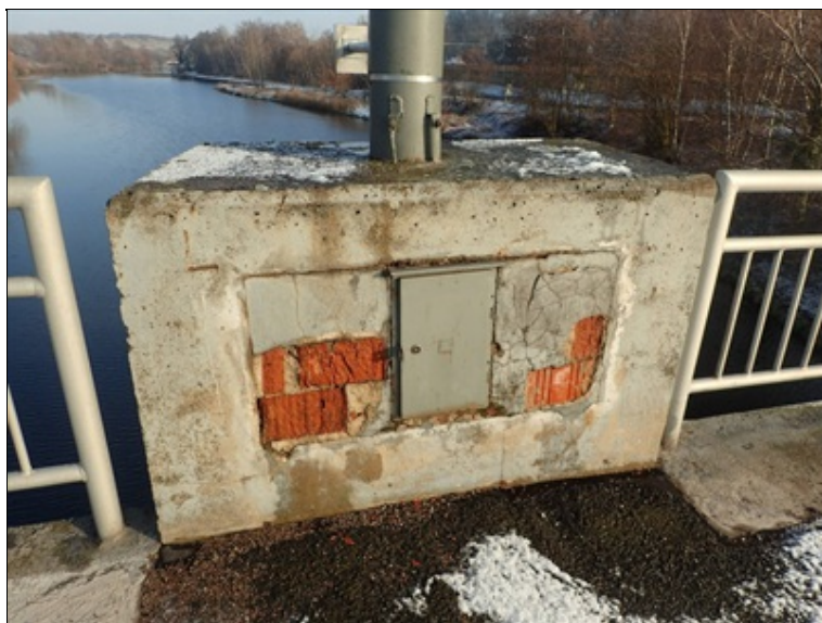
L chodník, parapetní zídka nad P3.