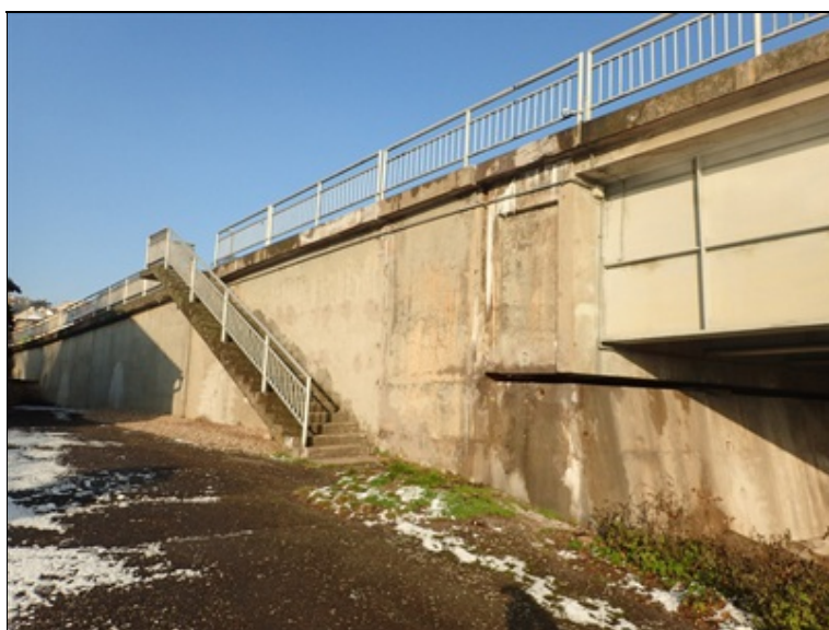
P bok opěry O1 + navazující opěrná zeď + přístupové schodiště.

Dilatační spára ve styčném koutě koncového příčnicku a křídla zcela sevřená. Na boku příčnicku zde došlo následkem kontaktu k odlomení celého svislého žebra prolisu.