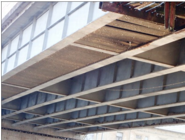
Pole 2, pohled NK z L boku od P2.