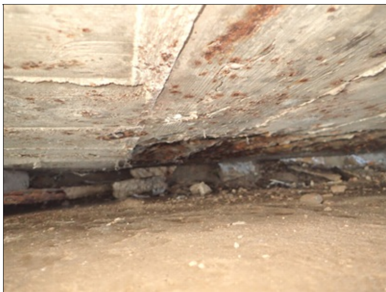
Opěra O1, pohled do mezery mezi úložným prahem a koncovým příčnickem.