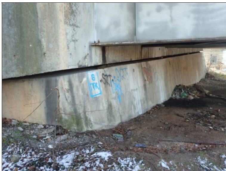
Líc opěry O4 z L boku.