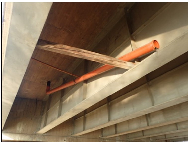
Pole 1, pohled NK u L boku.