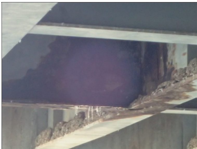
Pole 3, pohled NK, detail intenzivní koroze v úseku za pilířem P3.

Spodní pásnice ocel. nosníků v poli 2 a 3 pokrývá mocná vrstva holubího trusu + hnízd. Je překážkou provádění nezbytné kontroly a údržby pohledu NK.