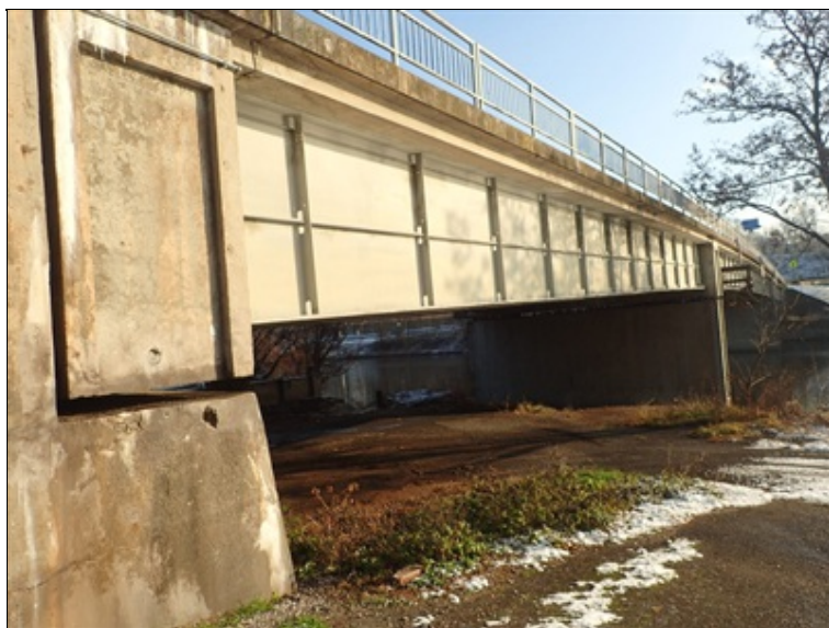
P bok mostu, opěra O1, pole 1.