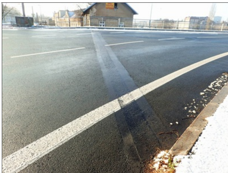
Pohled v linii EMZ nad opěrou O4.