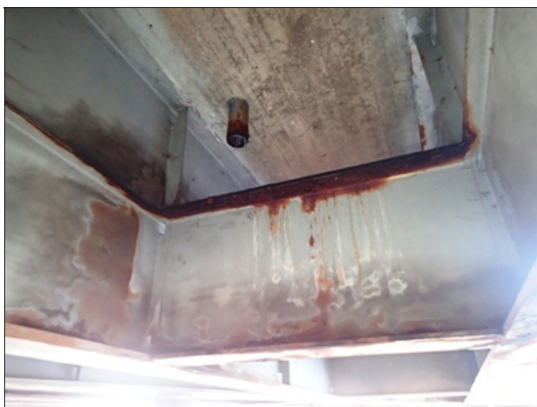
Pole 3, pohled NK, úsek před O4, mezi L krajními nosníky.

Krajní nosníky a k nim připojené příčníky postiženy korozi v ploše, na kterou se rozstříkuje voda z odvodňovačů. Oslabení průřezové plochy postižených částí do 5%. V okamžiku prohlídky zde mokrá povrch.