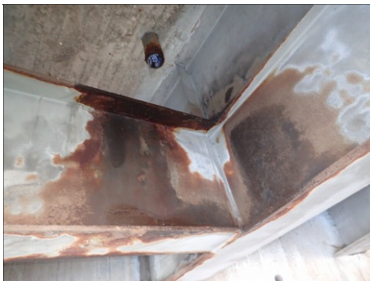
Pole 3, pohled NK, mezi L krajními nosníky, úsek před O4.