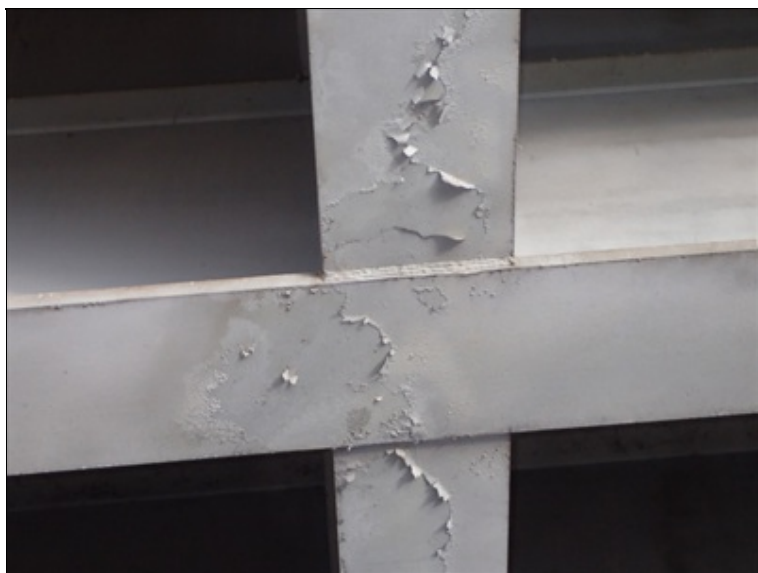
Pole 1, detail z pohledu NK.

V oblastech bez zatékání je místy patrné loupání PKO, ojediněle koroze v hranách pásnic, prozatím bez oslabení průřezové plochy.