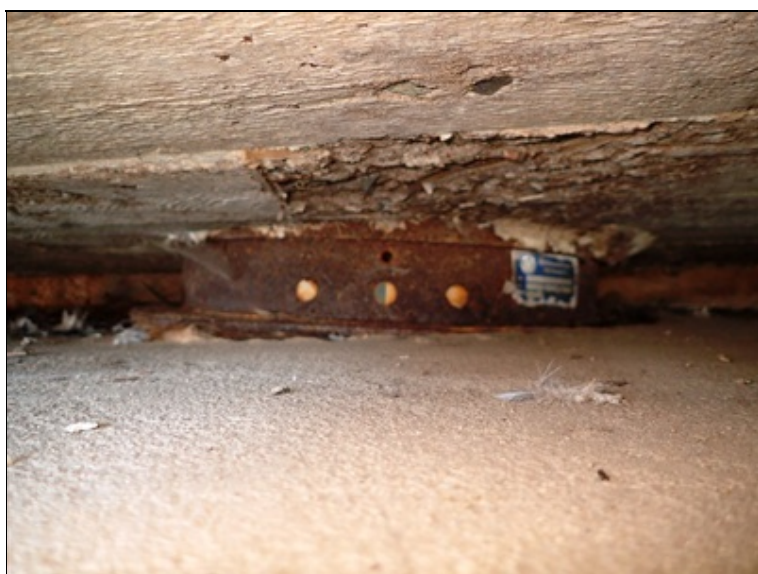
Opěra O4, L ložisko.