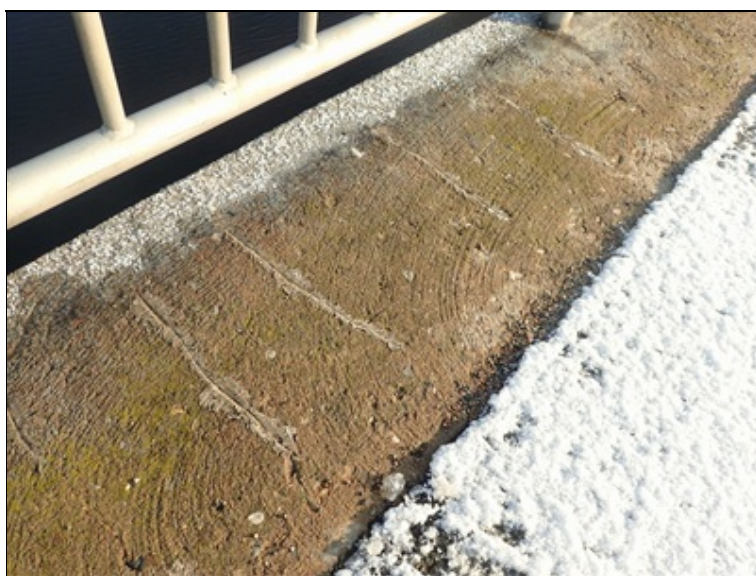
Horní povrch L římsy.