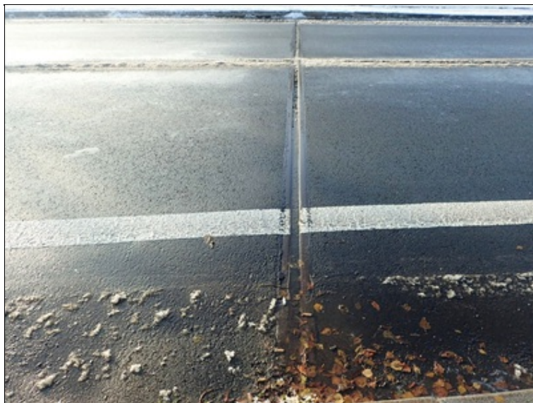
Pohled v linii mostního závěru nad opěrou O1.