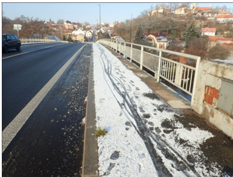
L chodník od P3.