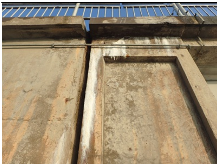
P bok O1, pohled vzhůru k římsě, dilatační spára za koncem NK.