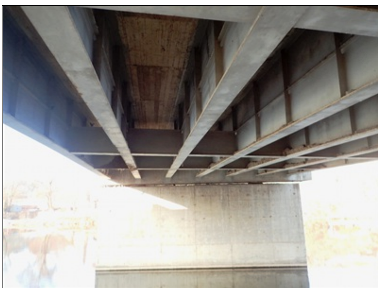
Pole 3, pohled NK, střední část, směrem k P3.

Na vnějším boku P krajního nosníku výrazná korodující plocha pod skvrnou na pohledu konzoly mostovky. nejspíše zde prosakuje voda.