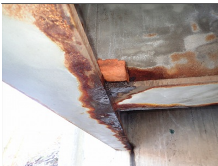
Pole 3, pohled NK, úsek před O4, spodní pásnice L krajního nosníku.

Provizorní ležaté PVC svody nejsou osazeny důsledně v celé délce mostu. Z řady odvodňovačů nadále zatéká na ocel. NK.