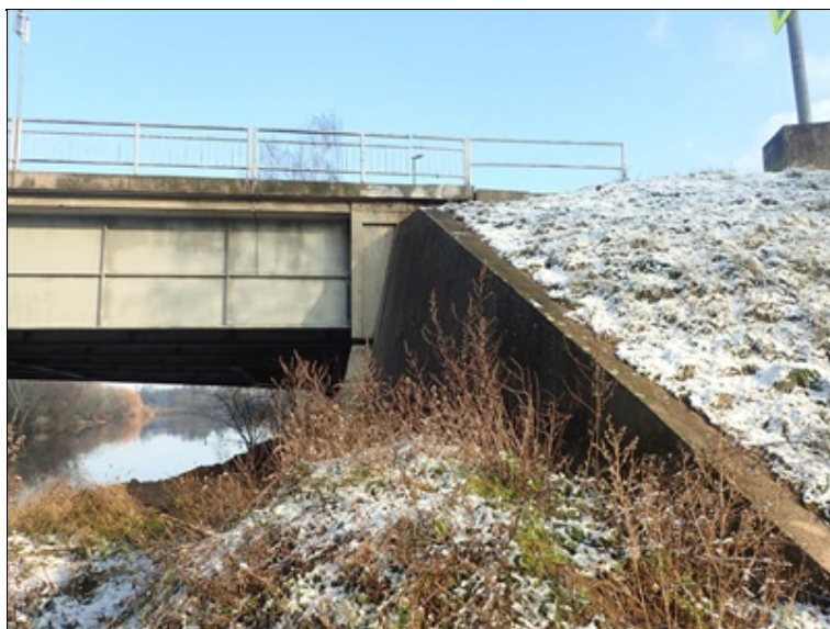
P bok mostu, konec pole 3, opěra O4.