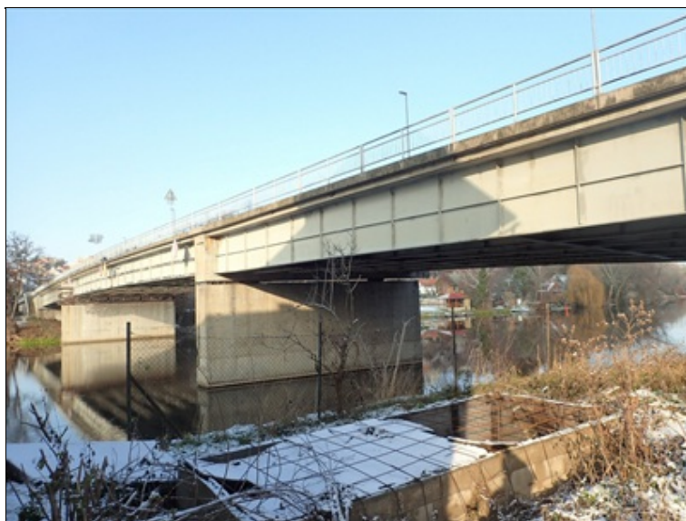
P bok mostu, pole 2, 3, pilíř P3.