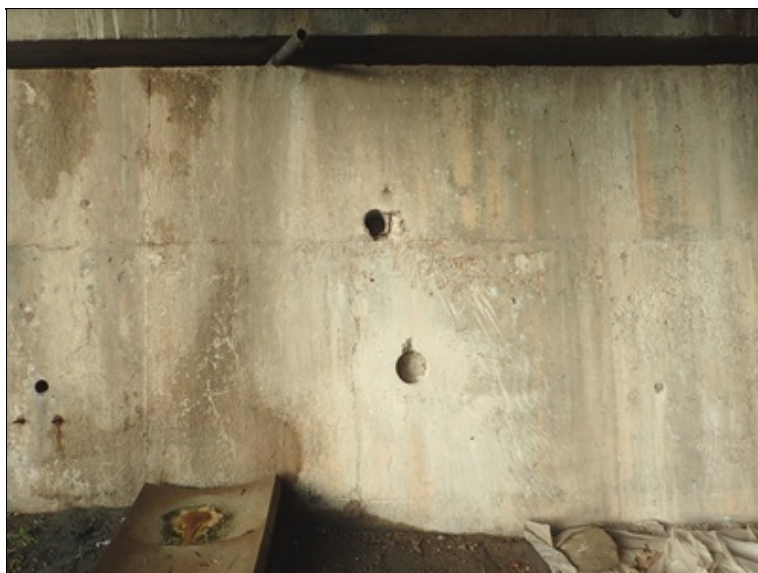
Detail líce O1.

Cihelné obezdívky instalačních skříní vykazují mrazový rozpad, omítka opadaná.