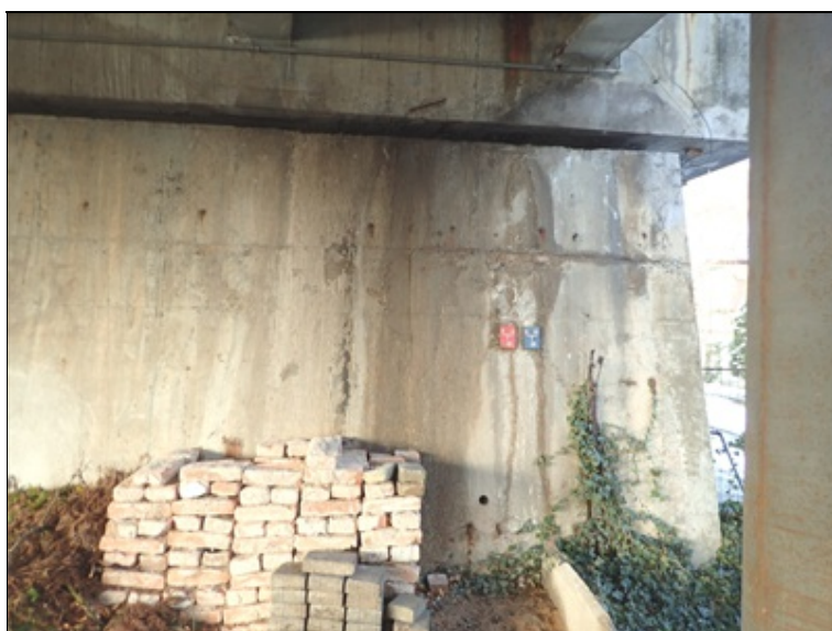
L strana líce dříku O1.