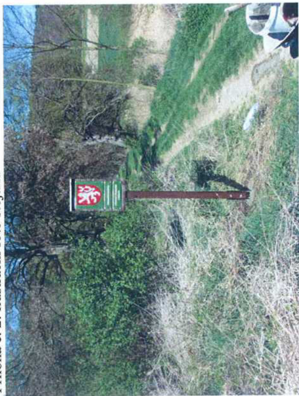
Příloha č. 2: Ilustrační foto stojanu