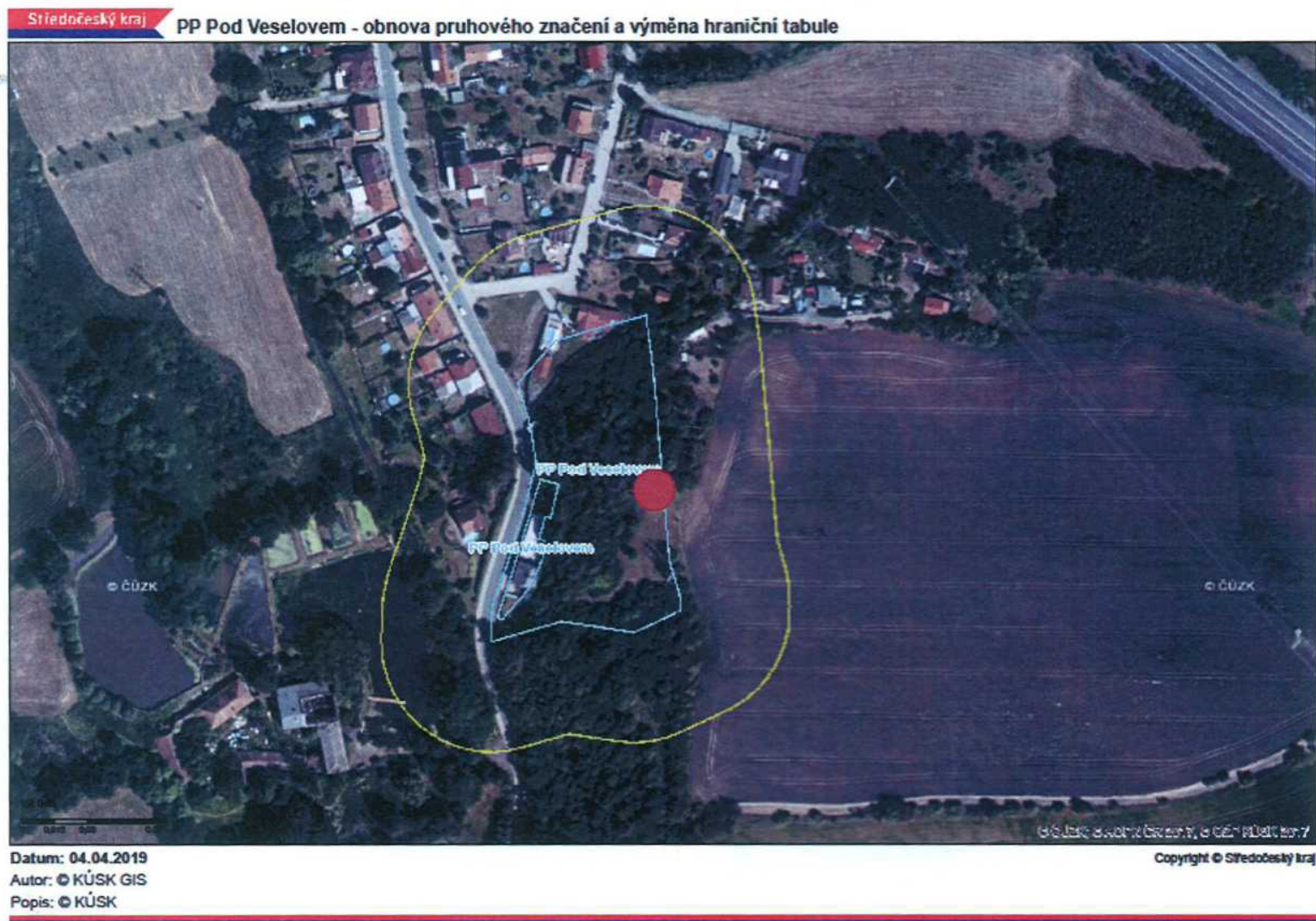
Příloha č. 1: PP Pod Veselovem – obnova pruhového značení a obnova hraničního značení (červená tečka)