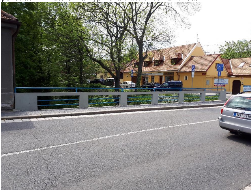
Pohled na vozovku, vodící proužek a chodník

Vozovka na mostě není opatřena dilatací. Na začátku i na konci mostu se ve stávající vozovce nachází příčná trhлина. Po provedení nového krytu z litého asfaltu bude na obou koncích mostu provedena příčná řezaná spára tl. 15 x 40 mm, která bude opatřena penetračním nátěrem a vyplněna elastickou záplivkou.