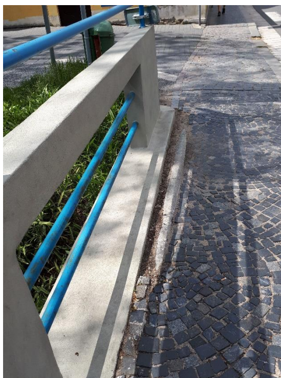
Pohled na chodník vpravo u opěry 1