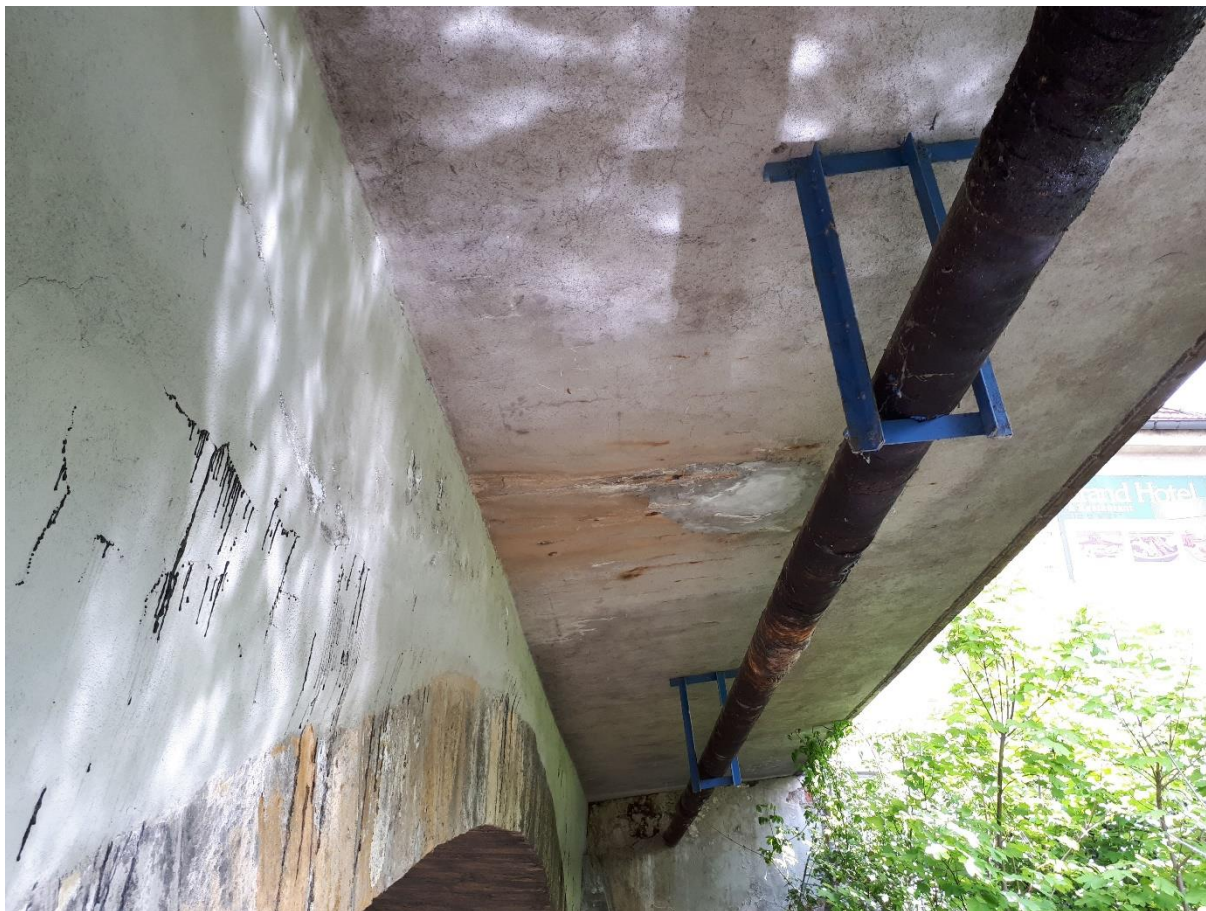
Pohled na čelní stěnu a žlb. konzolu na výtoku