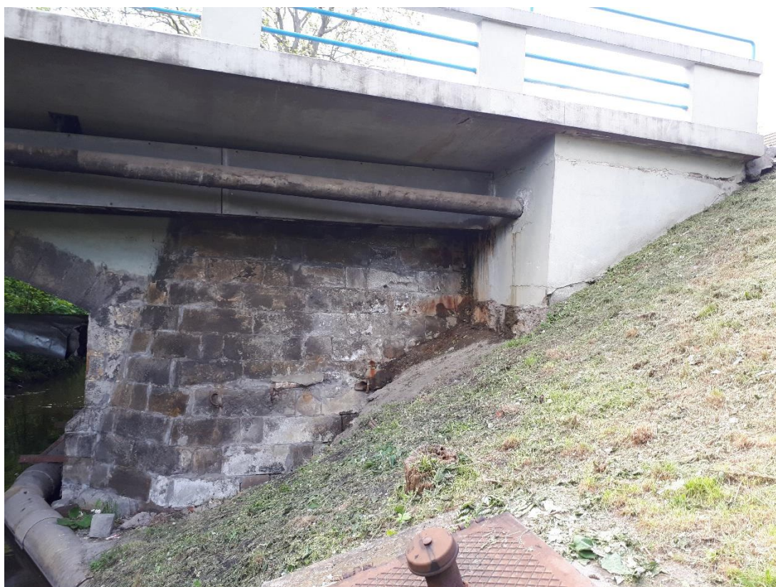
Pohled na sesunutý svah vlevo u opěry 1