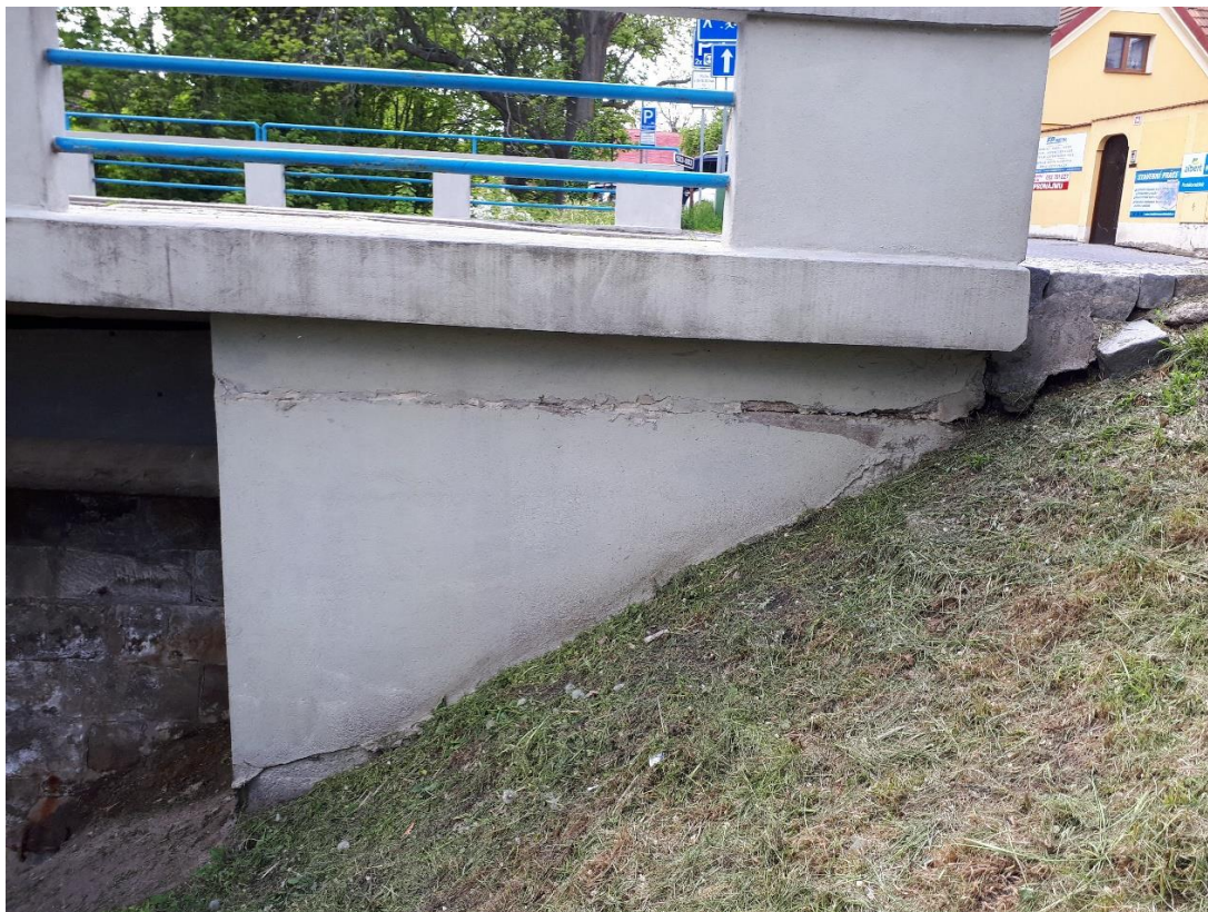
Pohled na bet. křídlo vlevo u opěry 1