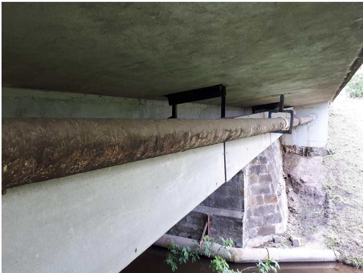
Pohled na levou konzolu NK