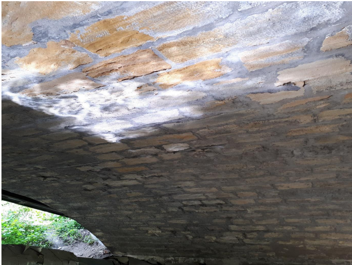
Pohled na klenbu a opěru 2

Nosná konstrukce kamenného mostu je oboustranně rozšířena žlb. deskou, jejíž spodní povrch vykazuje závady spočívající v lokálním odpadávání krycí vrstvy výztuže a ve vzniku vlasových trhlin na povrchu desky. Navržena je proto sanace 100 % spodního povrchu obou rozšiřujících konzol NK. Sanace bude provedena následujícím způsobem: