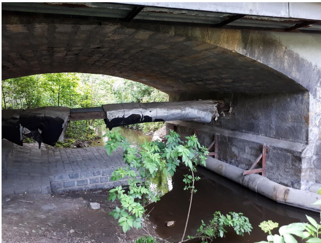
Pohled na opěru 1