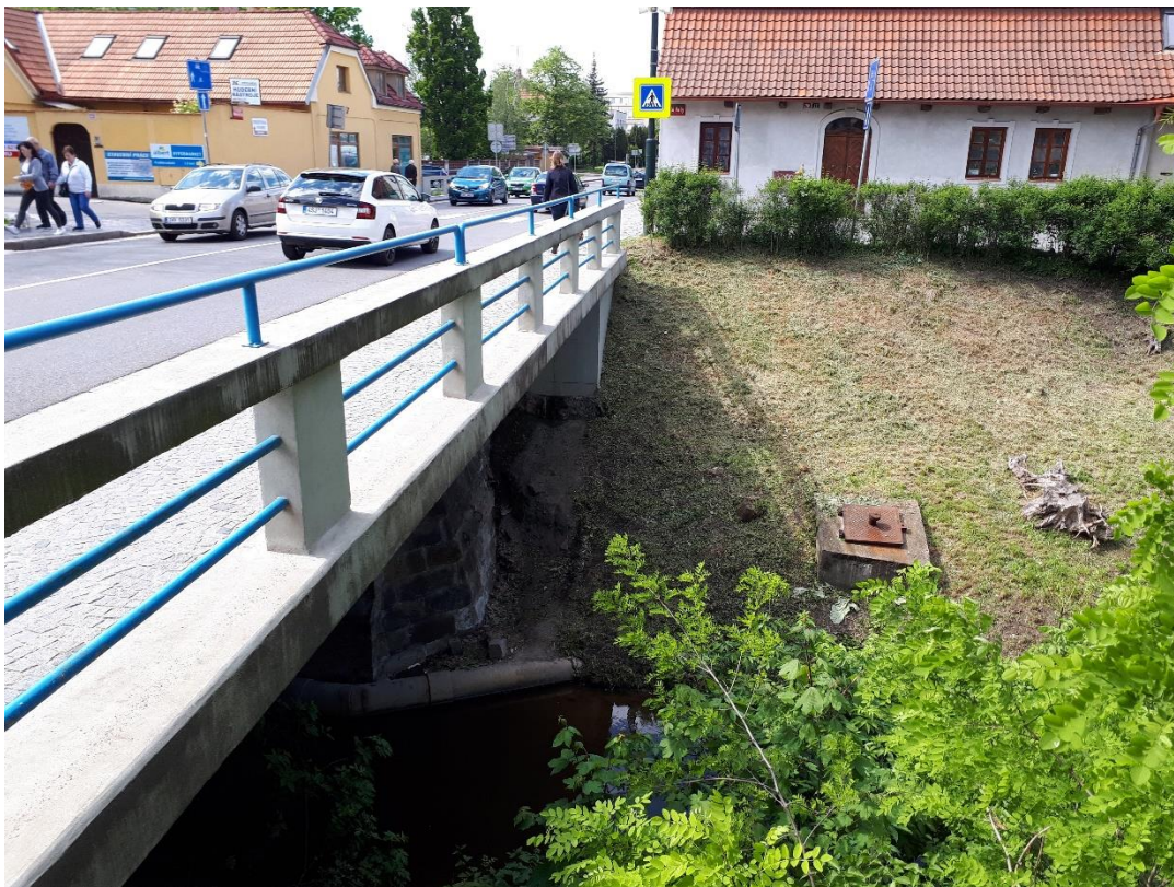
Pohled na zábradlí vlevo mostu