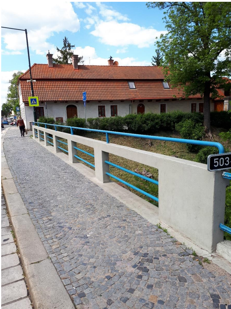
Pohled na levou římsu