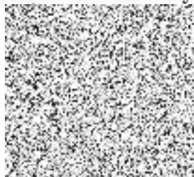
Martin Herman radní pro oblast investic a veřejných zakázek