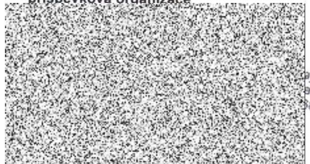
ředitel Školní statku SK,PO

Kupující Školní statek Středočeského kraje, příspěvková organizace