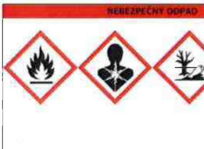
Obr. 1: Vzor štítku pro označování nebezpečného odpadu

Všechny nebezpečné odpady vznikající při činnosti Z25 SČK musí být označeny štítkem nebezpečného odpadu a identifikačním listem nebezpečného odpadu.