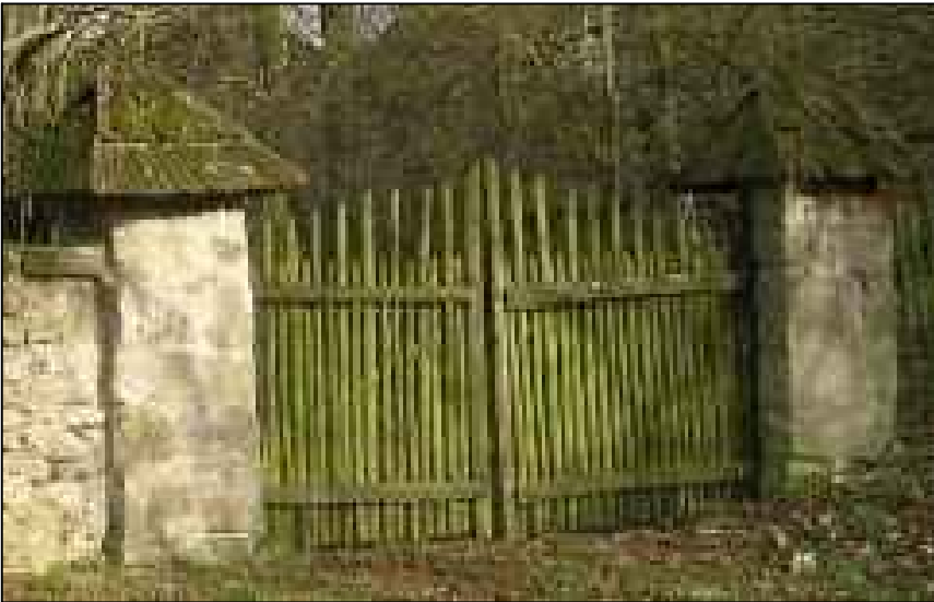
FOTODOKUMENTACE PŮVODNÍCH VRAT