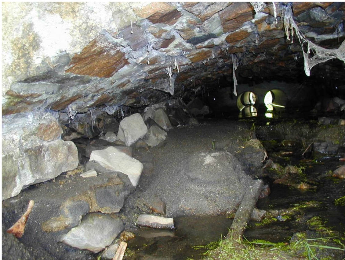
Obrázek 1: Rozpadlé opěry klenby včetně trubního prodloužení mostu