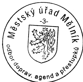
Hana Kunclová odbor dopravních agend a přestupků, speciální stavební úřad

Odvolání se podává s potřebným počtem stejnopisů tak, aby jeden stejnopis zůstal správnímu orgánu a aby každý účastník dostal jeden stejnopis. Nepodá-li účastník potřebný počet stejnopisů, vyhotoví je správní orgán na náklady účastníka. Odvoláním lze napadnout výrokovou část rozhodnutí, jednotlivý výrok nebo jeho vedlejší ustanovení. Odvolání jen proti odůvodnění rozhodnutí je nepřipustné.