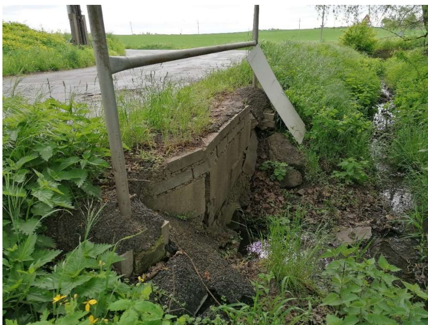
Pohled na výtok

Propustek je tvořen rozpadlými betonovými čely osazenými rezivělým zábradlím. V rámci opravy komunikace bude propustek obnoven formou ŽB trouby DN 500 délky 7,90m.