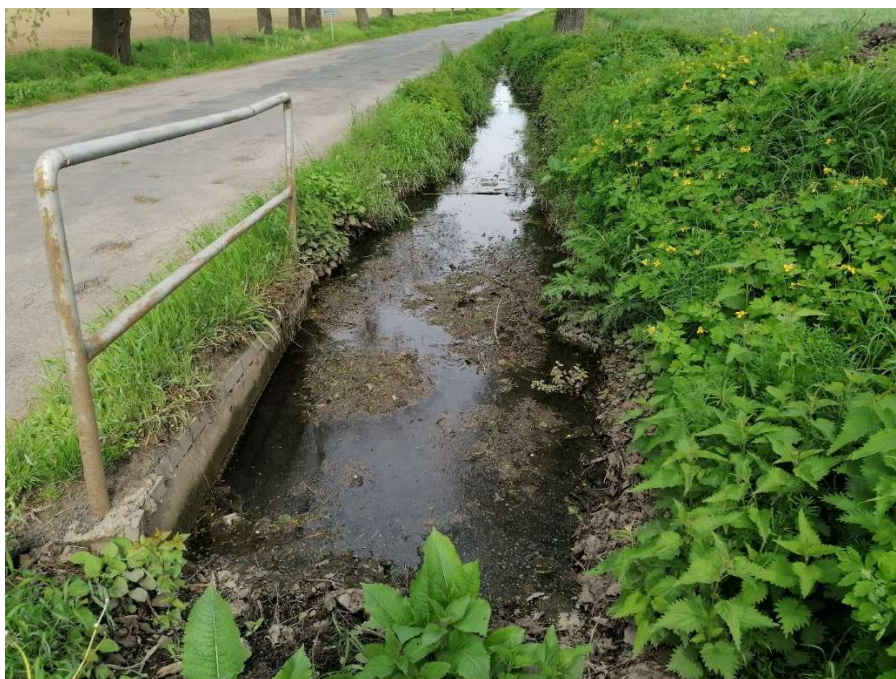
Pohled na vtok