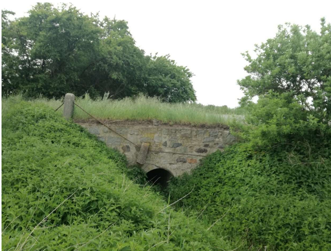
Pohled na výtok