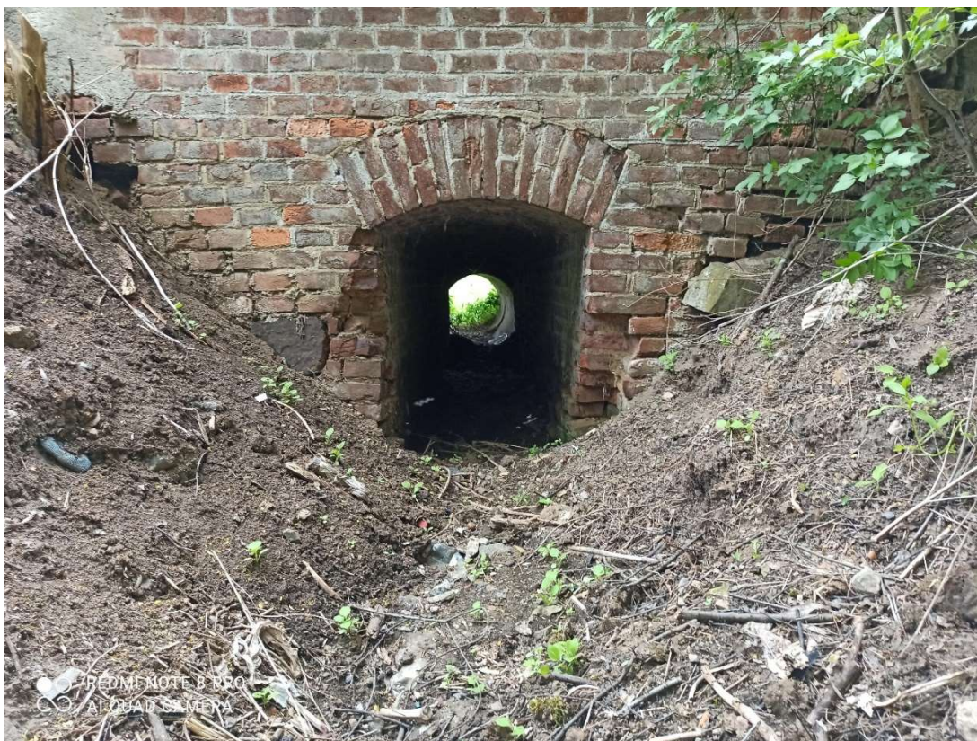
Pohled na vtok

Propustek v km 2,264 DN 1000 délky 10,0 m