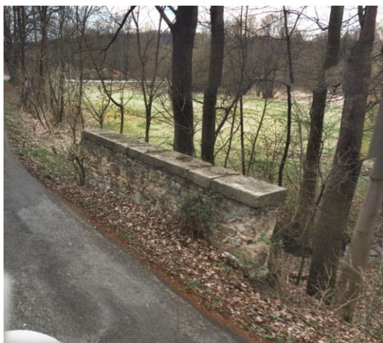
Nebezpečné čelo propustku

V rámci snížení vyvýšeného čela propustku dojde také k sanaci celého čela. Dojde k celkovému vyčištění trouby a koryta od náletových porostů, travin a půdních nánosů. Sanace kamenné klenby a čela v celém rozsahu, opravy spár (proškrábnutí a odstranění uvolněného materiálu, vyplnění dutin vhodnou cementovou maltou a přespárování).