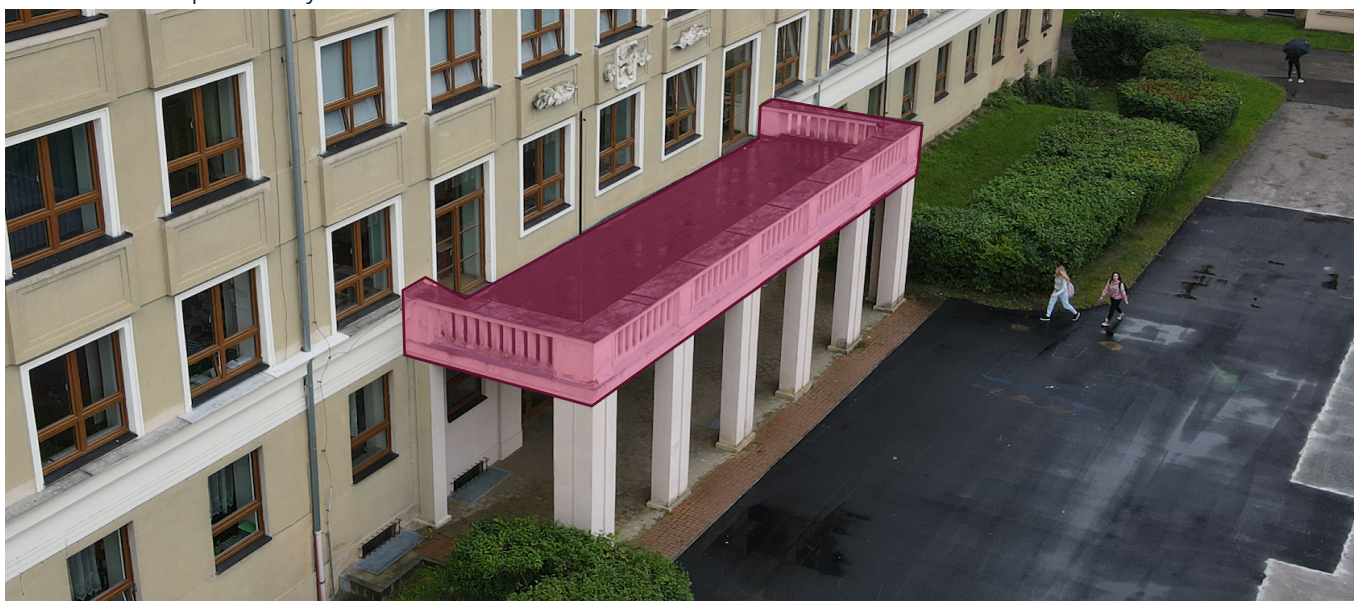
Obrázek č.1 : Vstup do budovy

Zadavatel požaduje opravu terasy nad hlavním vstupem viz foto níže. Součástí rekonstrukce bude oprava trhlin, oprava omítky včetně barvy, vybourání stávající vrstvy terasy, nové hydroizolace a nová lehká pochozí vrstva.