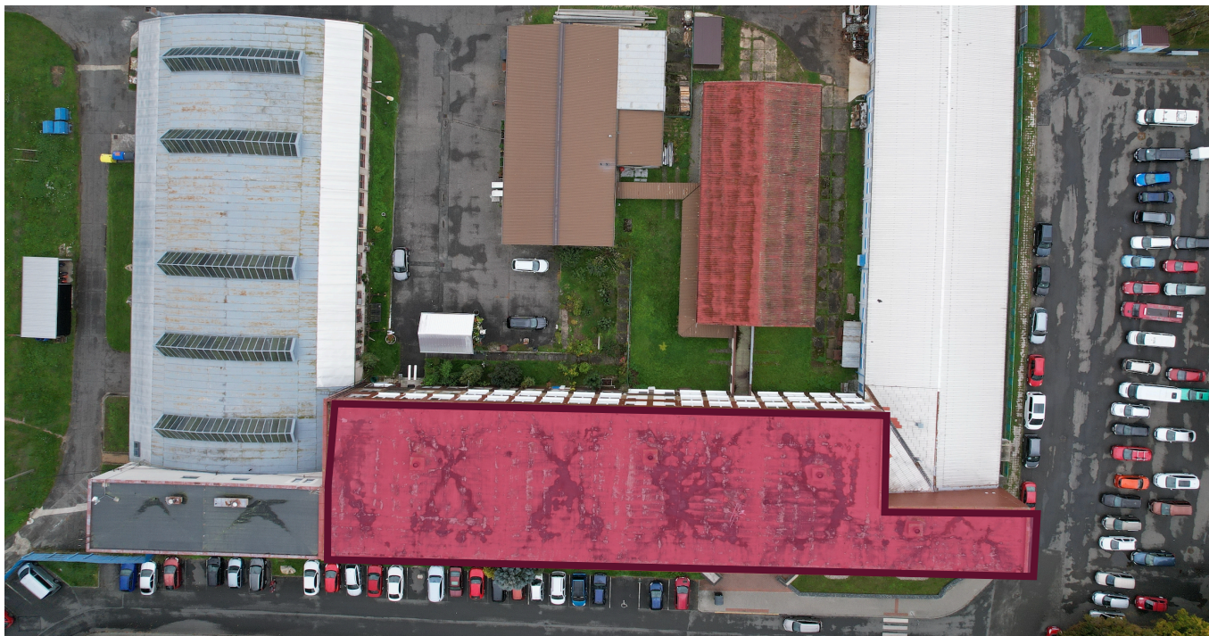
Obrázek č. 5: Střešní konstrukce určená k výměně a zateplení