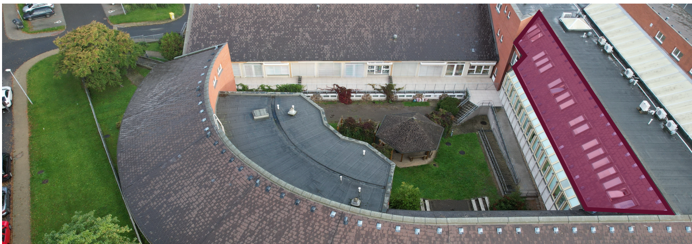
Obrázek č. 3: Výměna střešní krytiny SŠ, ZŠ a MŠ Rakovník

Výměna je požadovaná pouze v místech napojení na plochou střechu, u které je rovněž požadavkem na výměnu krytiny.