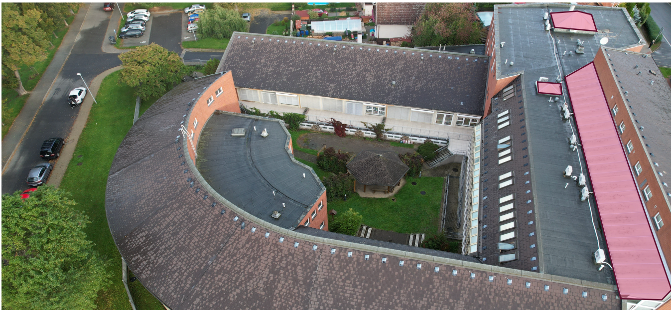
Obrázek č. 4: Měněné světlíky SŠ, ZŠ a MŠ Rakovník

Mimo výměnu popsanou v energetickém posudku, zadavatel požaduje výměnu stávajících polykarbonátových světlíků.