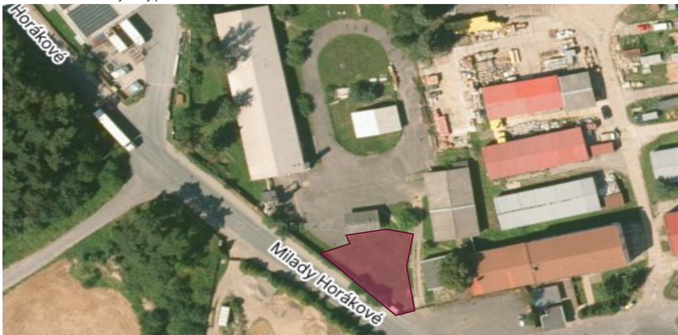
Obrázek č.2 : Prostor vybraný pro umístění FVE

V opačném případě prosíme o instalaci do níže vyznačeného prostoru: