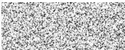
za stranu prodávající Son Pham Hung