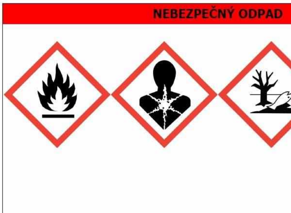
Obr. 1: Vzor štítku pro označování nebezpečného odpadu