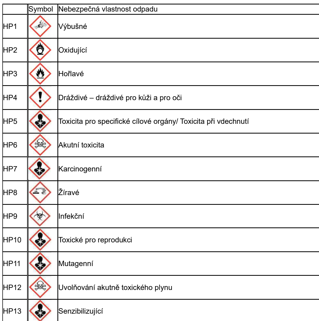
Tab. 1: Nebezpečné vlastnosti odpadů