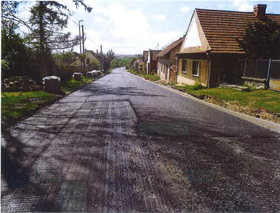
Detail geomíře a ložné vrstvy