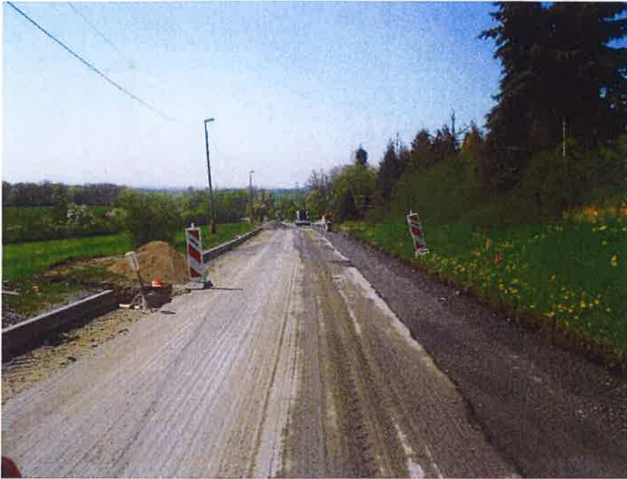
Detail prováděných sanačních prací