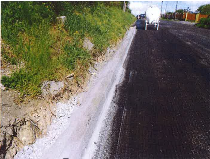
Detail konstrukce vozovky s částí sanačí a geomříží