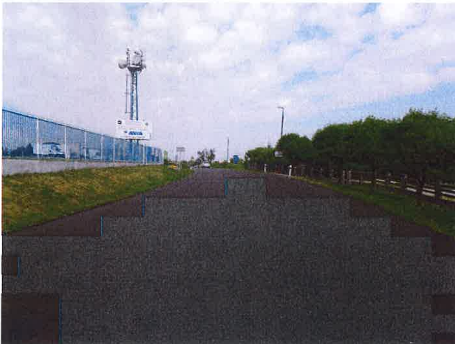
Ložná vrstva k benzince